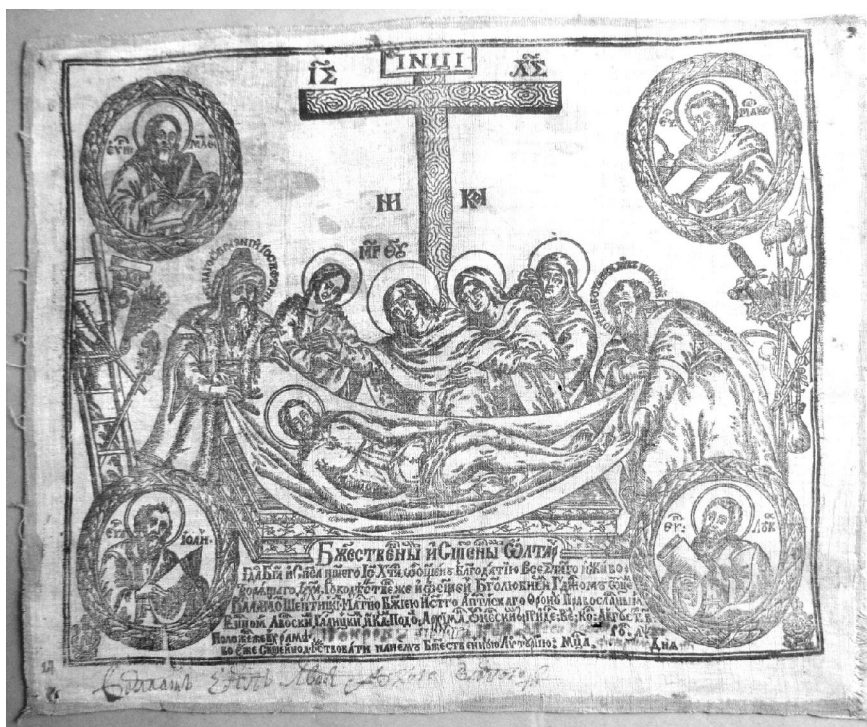
1. Портрет владики Варлаама Шептицького. Копія 1930-х рр. 2. Печатка владики Варлаама. 1711 р. 3. Печатка владики Варлаама. 1714 р. 4. Антимінс владики Варлаама. 1714 р. (НМЛ. Відділ графіки. – Гд-30)