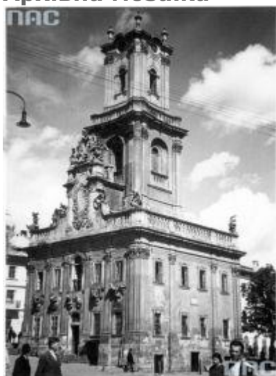
Ратуша в м. Бучач