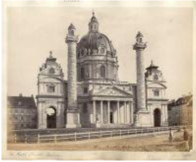
Костел Святого Карла у Відні

Таким чином, у розвитку львівської архітектури другої третини XVIII ст. найбільшого розмаху досягло будівництво об'єктів сакрального характеру. Аналіз відомостей з історії львівського середовища архітекторів показав, що найпомітніший слід залишили майстри 30–50-х рр. XVIII ст. Творчість архітекторів у Львові показала досить скромну активність місцевих митців й засвідчила цілковите домінування у їхньому середовищі провідних будівничих з-поза меж міста.