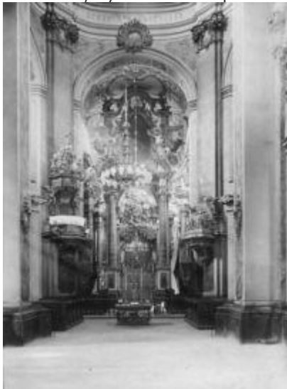
Інтер'єр Собору Святого Юра

початку XIX ст. подав у своїй статті Б. Януш 2 . Серед дослідників, що зверталися до львівської тематики, був також І. Крип'якевич, який популяризував середньовічний Львів 3 .