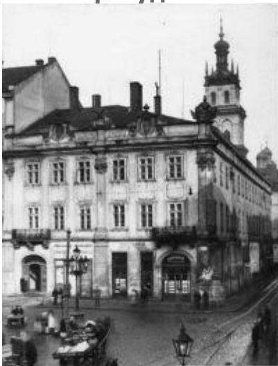
Палац Любомирських у Львові