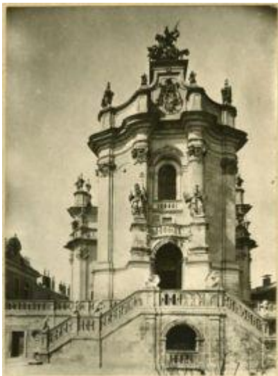
Собор Святого Юра, Львів

Львів відомий в історії України як унікальне місто з характерними лише для нього особливостями, симбіозом різних людських, культурних і господарських факторів, об'єднаних в єдину цілість. Залишаючись важливим урбаністичним центром Східної Європи він зберігає свою своєрідність, визначену його географічним розташуванням, в котрому тісно переплелися особливості економічного та культурного характеру цивілізацій Заходу та Сходу. Своім прихильникам і шанувальникам він готовий представити понад п'ятдесят відсотків архітектурної спадщини України, що становить також і частку світової, за що був відзначений у 1998 р. відповідним статусом в списку ЮНЕСКО.