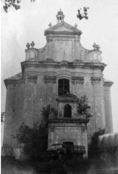
Костел Непорочного зачаття Діви Марії у смт. Лопатин

роботи проведено у 1749 р. в кам'яниці Жевуських 73 . 27 березня 1746 р. черський каштелян Казимир і Рудзинський уклали з Б. Меретином угоду на виставлення двох печей і виведення над дахом коминів. Одна піч мала бути виставлена "саксонським стилем", а друга львівським. Щодо першої, мова йде про копіювання популярної у першій половині XVIII ст. мейсенської порцеляни, що відзначалася притаманним лише їй вишуканим декором. Таку ж роботу майстер виконав у 1753 р. в палаці підвояводи львівського і коломиїського ловчого Яна Лаского 74 .