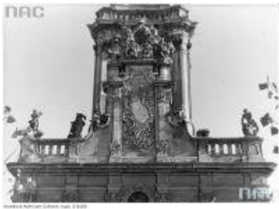
Ратуша в м. Бучач. Елемент фасаду