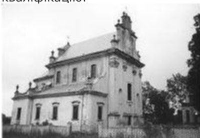
Костел Успіння Богородиці у с. Наварія

Б. Меретин зібрав досить чисельну групу працівників для втілення своїх проектів. Наприклад, в Бучачі з фірмою Б. Меретина співпрацювали декілька відомих різьбярів зі Львова. Як зазначав польський дослідник Збігаєв Горнунг, дець близько 1750 р. групу різьбярів будівельної фірми Б. Меретина у Бучачі очолив відомий скульптор Йоган Георг Пінзель, який за проектом архітектора зробив дві фігури, що стояли при дорозі до Бучача — Св. Яна Непомука (1750) і Богородиці (1751) 29 . У групі також працював інший різьбяр, учень Й. Пінзеля і Б. Меретина, Матвій Полейовський 30 . Присутність цих та інших майстрів у фірмі Б. Меретина свідчить про її високу кваліфікацію.