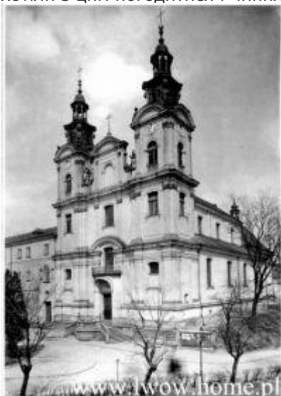
Костел Святої Марії Магдалини у Львові