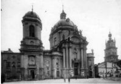
Домініканський костел у Львові

принесла де Вітте славу "великого архітектора Польщі" 130 . Після завершення цього проекту він отримав певну кількість пропозицій, втім також і в своєму рідному місті. Серед його праць на місцевому ґрунті треба відзначити костел домініканців, який розпочали реставрувати у 1737 р. коштами Михайла Франциска Потоцького, а також вірменський костел св. Миколая 131 . З проектів світських будівель середини XVIII ст. у Кам'янці-Подільському реалізовано проект будинку, де пізніше розташовувалась пожежна частина, а в 1770 р. — кам'яниці комендатури фортеці 132 .