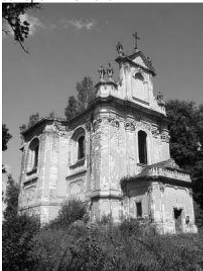
Костел Всіх Святих у с. Годовиця. Фото: Христина Одуха

Діяльність П'єра де Тіргайля у Львові розпочалася контрактом від 13 вересня 1759 р. для коронного підчашого Фелжса Чацького, який очолював королівську комісію, що займалася розв'язанням міських справ. Майстер опрацював проект будинку за єзуїтською хвірткою, беручи на себе здійснення цього проекту 53 . Проте, отримавши частину грошей, П. де Тіргайль не закінчив роботу, за що Ф. Чацький притягнув майстра до судової відповідальності 54 . На Галицькому передмісті під керівництвом П'єра де Тіргайля збудовано для надвірного ловчого Антонія Бельського палац 55 . У 1756 — 1760-х рр. за дорученням київського воєводи Франциска Потоцького архітектор розробив плани перебудови родинних палаців Потоцьких в Кристинополі 56 і Переспі 57 . Маємо також відомості про його проект і будівництво для львівських бернардинів млина оригінальної іспанської конструкції. Цей млин зацікавив коронного гетьмана Я. Браницького, про що свідчить його прохання до архітектора надіслати копло проекту і виконання моделі 58 . Як бачимо, Тіргайль добре зарекомендував себе серед львівської магнатерії, що дозволило йому отримувати замовлення й поза містом. Як свідчить З.Горнунг, близько 1760 р. П'єр де Тіргайль залишив Львів і виїхав знову до Варшави для опрацювання планів її забудови. Зокрема, однією з його робіт вважають палац магнатського роду Мнішек 59 , хоча цю версію заперечив Є.Ковальчик 60 .