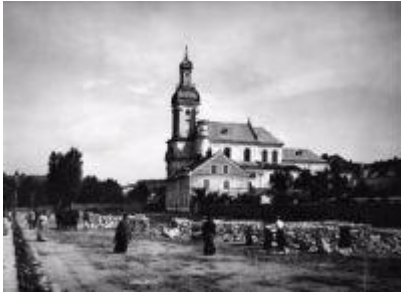
Костел Заручин Марії та монастир сакраменток, Львів.