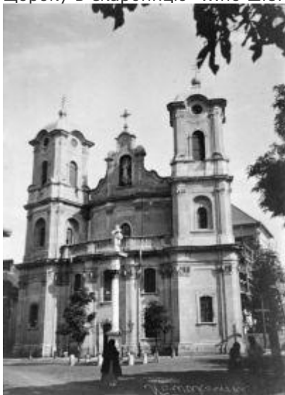
Костел Непорочного Зачаття Діви Марії у с. Городенка