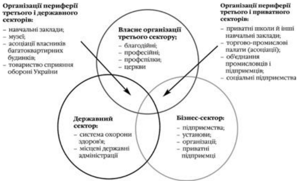
Рис. 1. Межі між третім, державним та приватним секторами