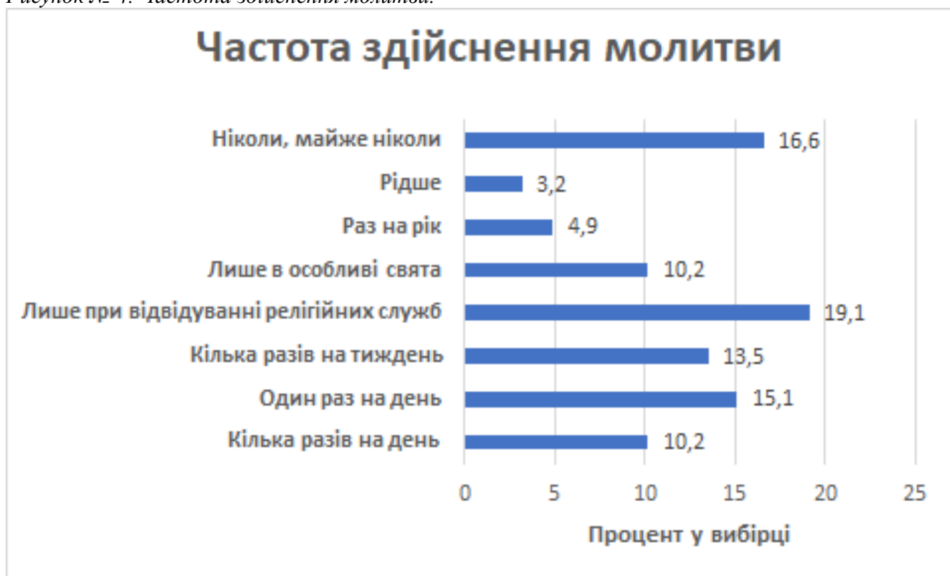
Рисунок № 4. Частота здійснення молитви.

Тож, згідно з аналізом, респонденти найчастіше моляться чи відвідують церковні служби кілька разів на рік, у відповідності до релігійних свят, що свідчить про пасивний прояв релігійності у розрізі практик, на відмінно від задекларованої самооцінки релігійності індивідів, що підтверджує Н1. Оскільки дійсно попри задекларовану високу релігійність (59,3%) населення сучасної України (див. Рис. 2), спостерігається виразна розбіжність щодо виконання базових конфесійних практик: лише 16,9% вірян відвідують служби раз на тиждень (див. Рис. 3) та всього 15,1% респондентів моляться раз на день (див. Рис. 4).