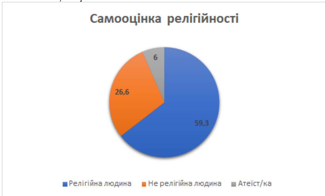
Рисунок № 2. Самооцінка релігійності