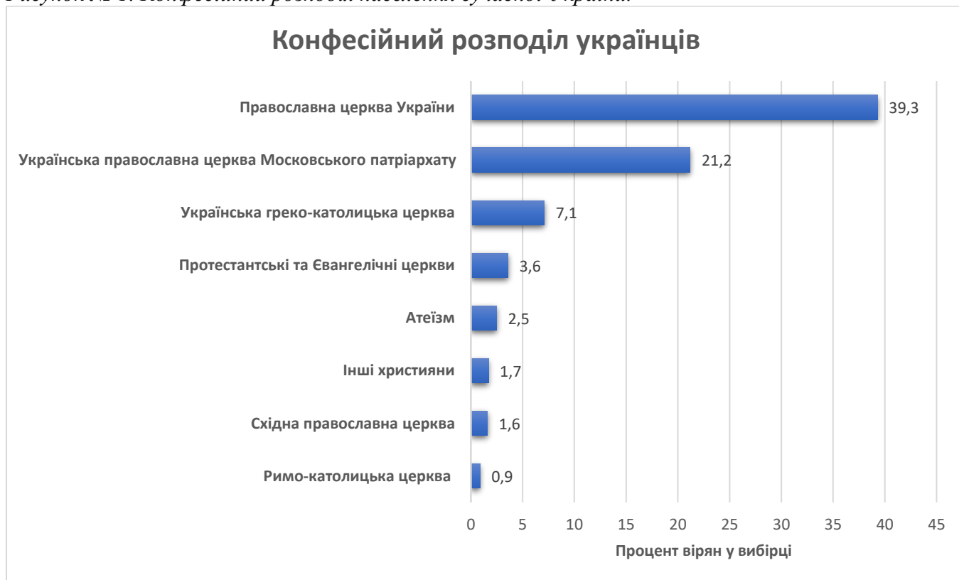
Рисунок № 1. Конфесійний розподіл населення сучасної України.