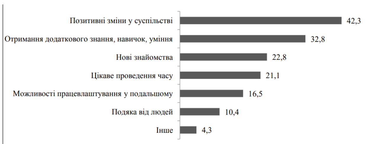
Рис. 5. Розподіл відповідей респондентів на запитання: «Що було б для Вас мотивацією займатися волонтерською діяльністю?» (N=12 430), %

Тобто, більш, як третина опитаних (38%) займалися волонтерською діяльністю протягом останніх 12 місяців, 52% не займалися волонтерською діяльністю взагалі, і 9,7% вказали варіант відповіді – важко відповісти. На питання, що стосувалось мотивації здійснювати волонтерську діяльність, «Більшість U-репортерів відповіли, що для них мотивацією займатися волонтерською діяльністю є позитивні зміни у суспільстві – 42,3%, отримання додаткового знання, навичок, уміння – 32,8%, нові знайомства – 22,8%, цікаве проведення часу – 21,1%, можливості працевлаштування у подальшому – 16,5%, подяка від людей – 10,4%, інше – 4,3%, важко відповісти – 0,9%» (Ніцполь, Нестеренко, 2018, ст. 112-119).