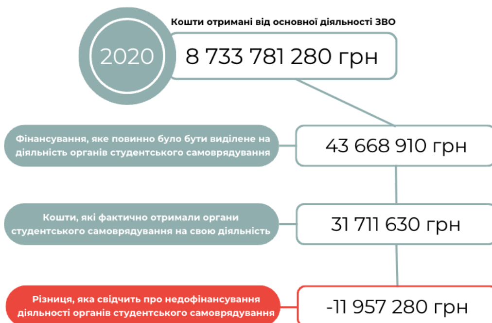
Рис. 1.3 Кошти, спрямовані ЗВО на діяльність ОСС у 2020 році згідно норми, що визначена Законом України «Про вищу освіту»

Проте за свідченням українських активістів далеко не всі університети дотримуються норми закону, всіляко обмежуючи фінансування зніційованих студентами проєктів і заходів.