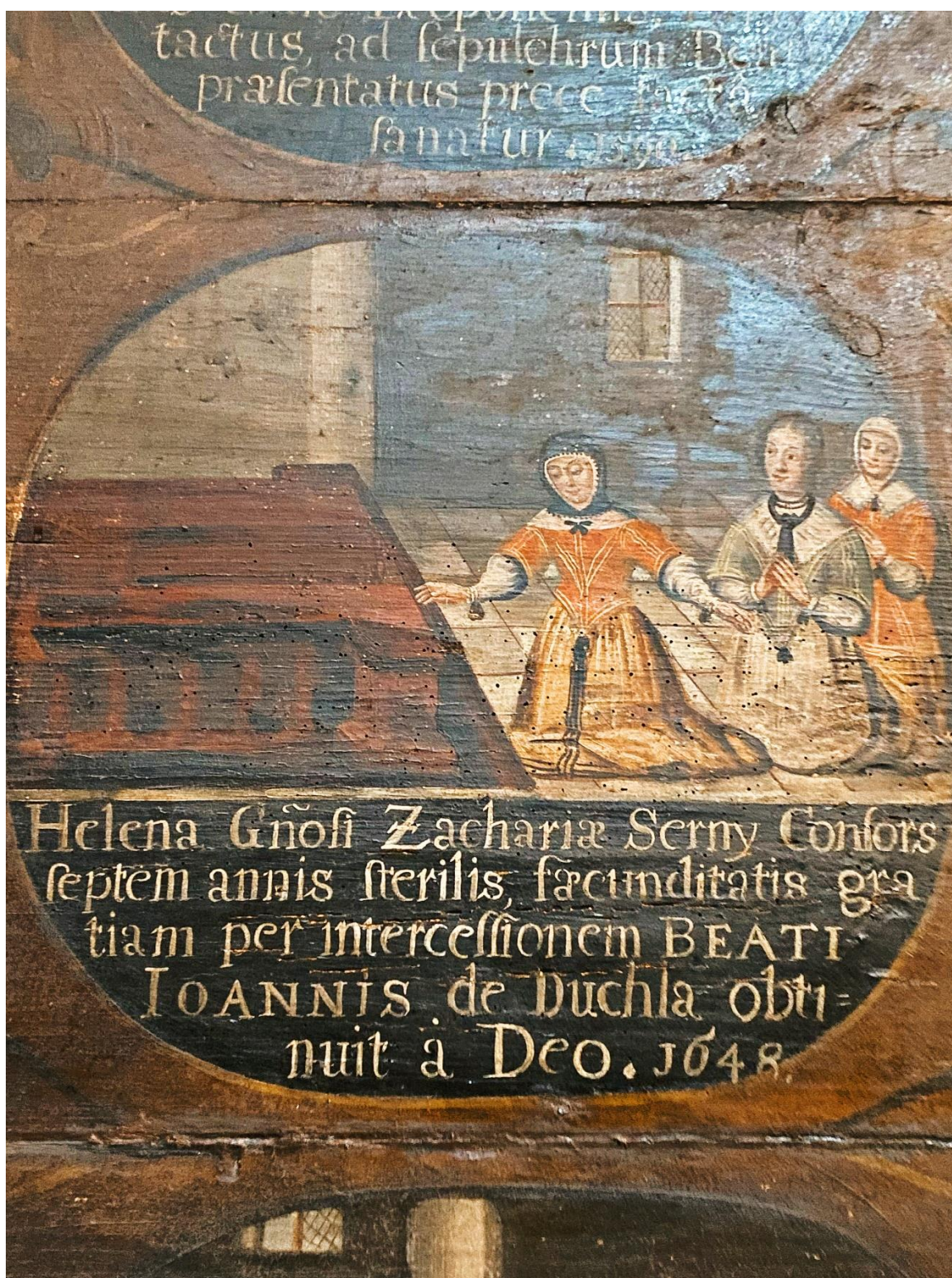
Приклад жіночого вбрання, XVII ст.