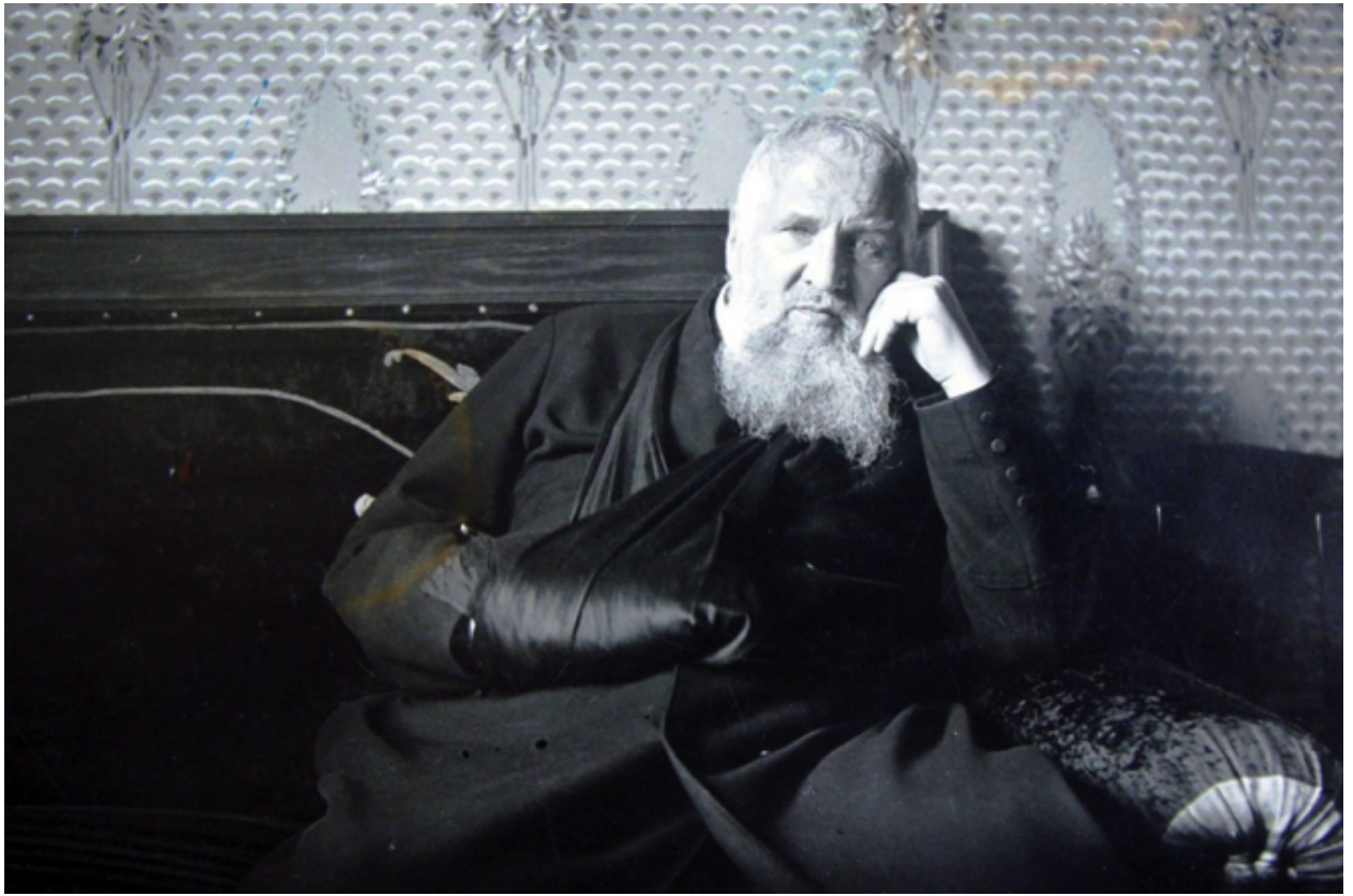
Митрополит Андрей у митрополичих палатах, з паралізованою правою рукою, 1930-ті р. (ЦДІАЛ, ф. 762, колекція фотоальбомів, фотографій, негативів і кліше)