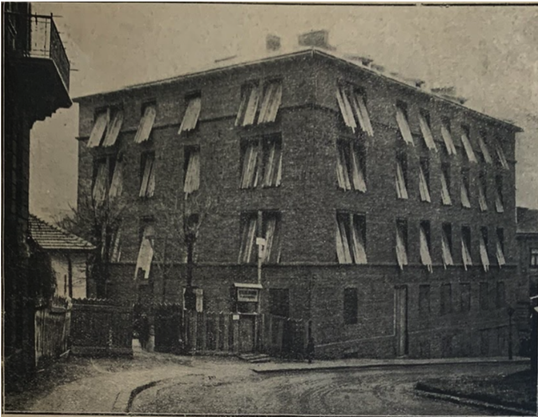
Будівництво шпиталю ім. Андрея Шептицького, 1930 р., Львів.