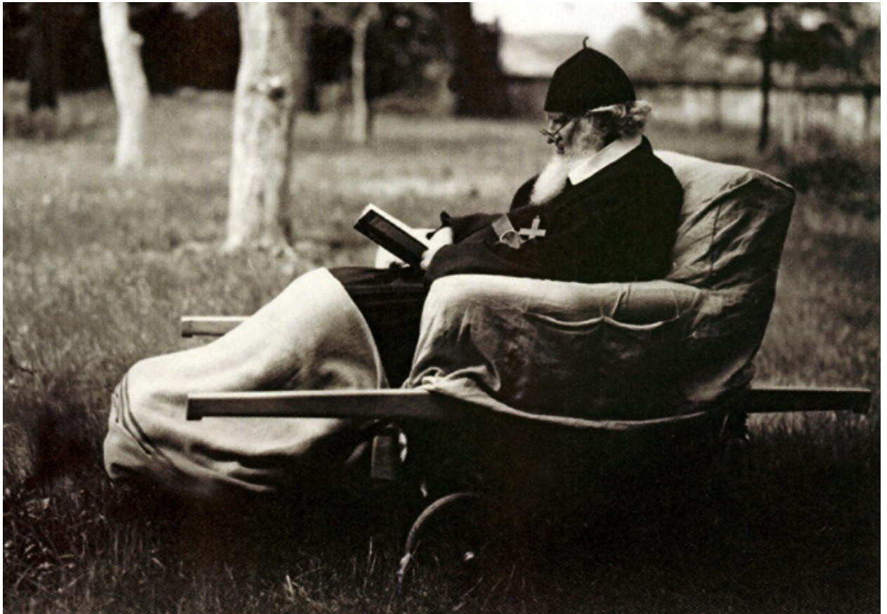
Митрополит Андрей у митрополичому саду поруч Собору св. Юра, на інвалідному візку, 1937 р.