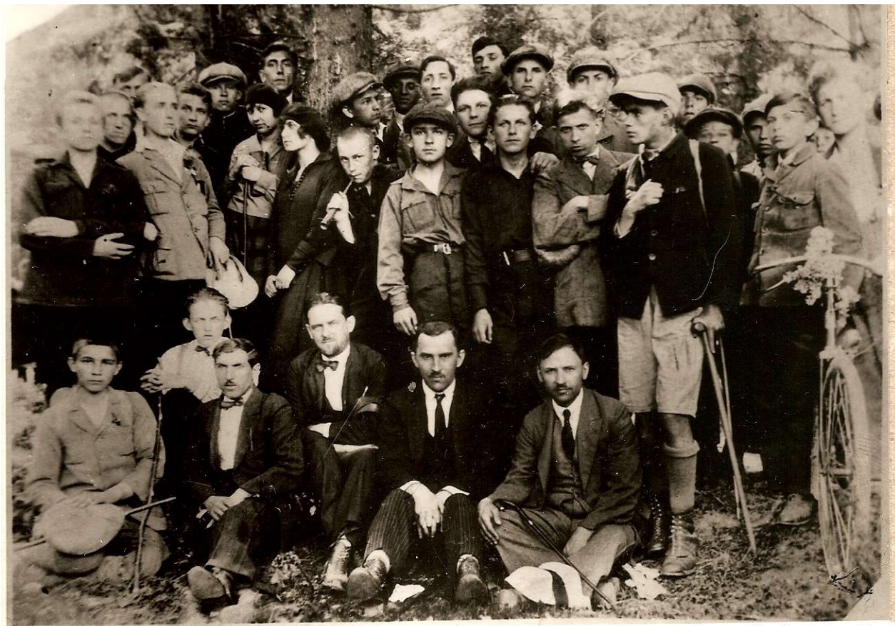
Степан Бандера (крайній справа біля велосипеда) з учнями і викладачами Стрийської гімназії