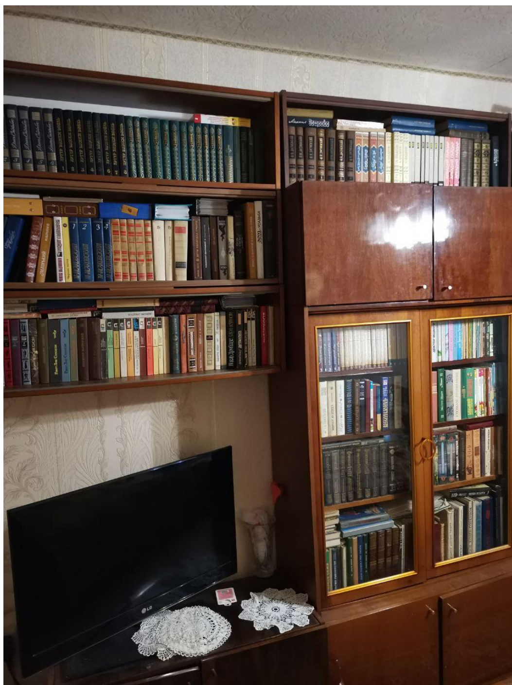
Додаток 1. Книжкова бібліотека. Приватна власність Добаріної Людмили.