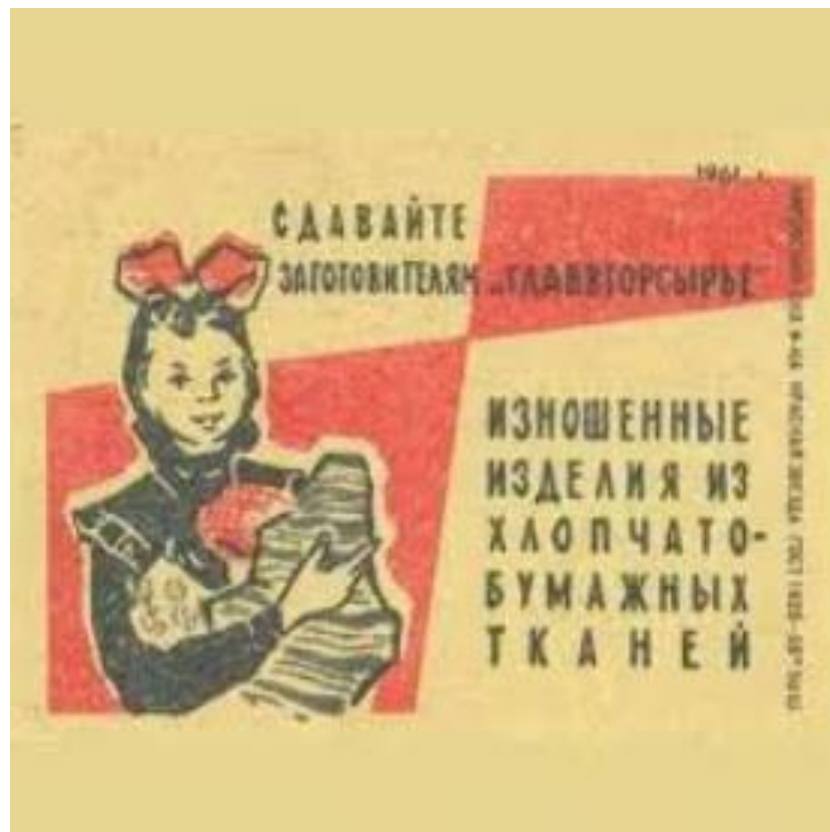
Додаток 4. Плакат-агітація про здавання виробів у спеціальні пункти прийому. 1961 рік