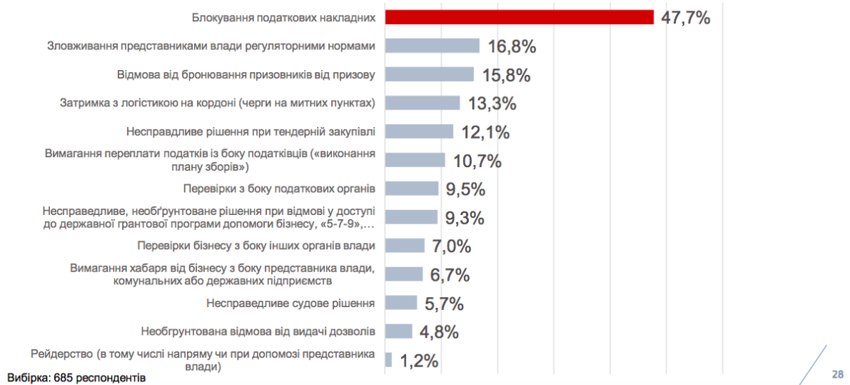
Рис. 2.4. “Проблеми у взаємодії з органами влади” [взято з: Дослідження стану бізнесу в Україні. Березень-квітень 2023, Advanter Group, с. 28]

З якими проблемами у взаємовідносинах з органами влади ваш бізнес стикався за останні 2 місяці?