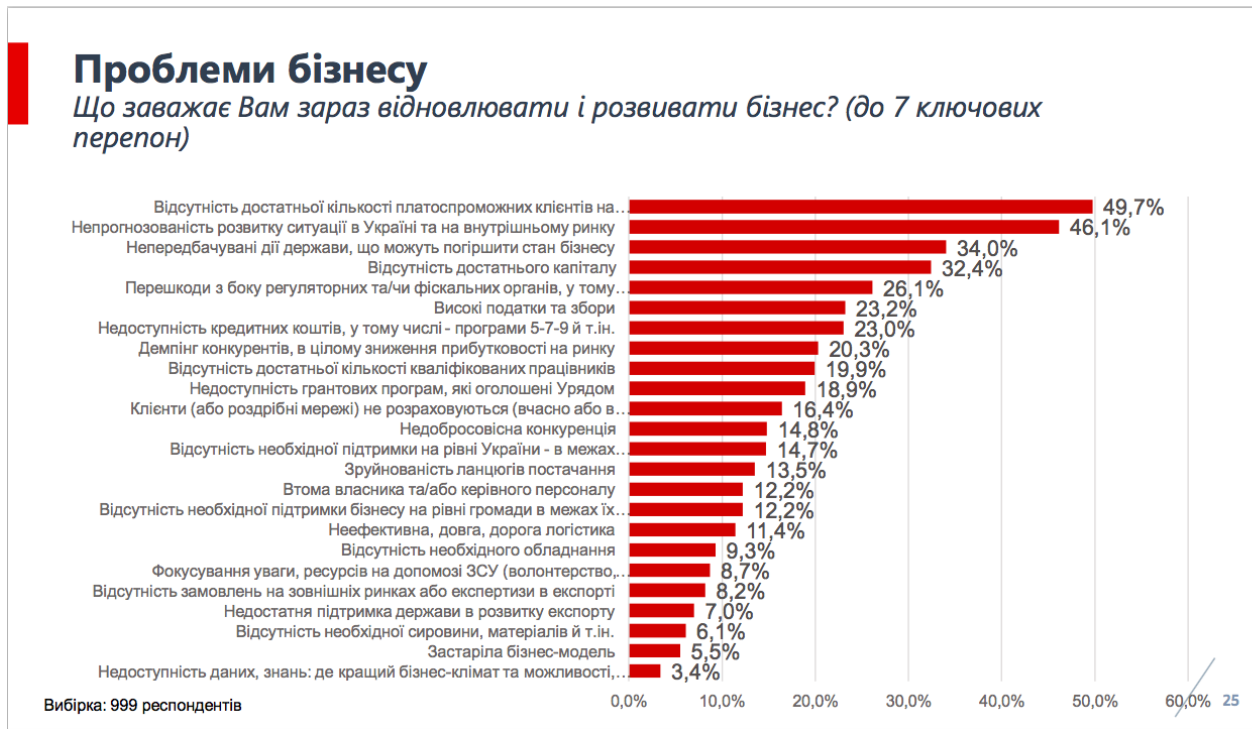
Рис. 2.3. “Проблеми бізнесу” [взято з: Дослідження стану бізнесу в Україні. Березень-квітень 2023, Advanter Group, с. 25]

Аналізуючи проблеми бізнесу, встановлені соціологічним дослідженням, можна помітити, що вони також підтверджують слова експертів. Так, в топ-7 ключових проблем входить відсутність достатньої кількості платоспроможних клієнтів (49,7%), непрогнозованість розвитку ситуації в Україні і на внутрішньому ринку (46,1%), непередбачувані дії держави, що можуть погіршити стан бізнесу (34,0%), перешкоди з боку регуляторних та/чи фіскальних органів (26,1%), високі податки і збори (23,2%), недоступність кредитних коштів (23,0%).