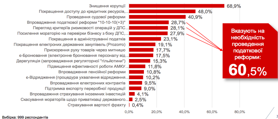
Рис. 2.6. “Задачі влади” [взято з: Дослідження стану бізнесу в Україні. Березень-квітень 2023, Advanter Group, с. 31]