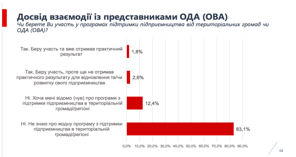
Рис. 2.2. “Досвід взаємодії із представниками ОДА (ОВА)” [взято з: Дослідження стану бізнесу в Україні. Березень-квітень 2023, Advanter Group, с. 58]

учасників опитування регулярно взаємодіють з органами влади, входять в робочі групи, беруть участь у різних заходах дослідження.