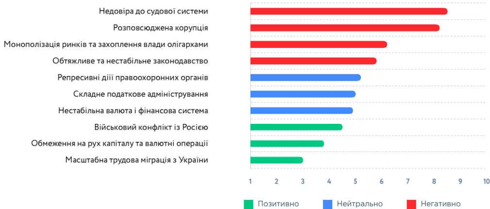
Рис. 2.5. “Основні перешкоди для іноземних інвестицій в Україну” [взято з: П’яте щорічне опитування для інвесторів, Листопад 2020, Європейська Бізнес Асоціація, с. 4]

Якщо порівняти рис.2.4. і рис.2.5, можна побачити, що проблема недовіри до судової системи – це питання не нове і не спричинене повномасштабною війною. Європейська Бізнес Асоціація провела в листопаді 2020 року щорічне опитування інвесторів, яке, зокрема, охоплювало питання основних перешкод для іноземних інвестицій в Україну. [15, 33, с.4] Найбільшими перешкодами інвестори назвали недовіру до судової системи, розповсюджену корупцію, монополізацію ринків і захоплення влади олігархами, обтяжливе та нестабільне законодавство.