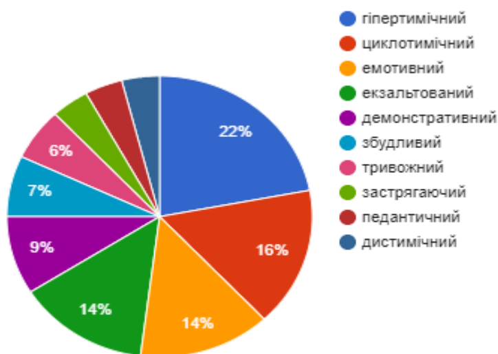
Рис. 2.2. Результати опитувальника «Методика визначення акцентуацій характеру К. Леонгарда (модифікація Г. Шмішека)»