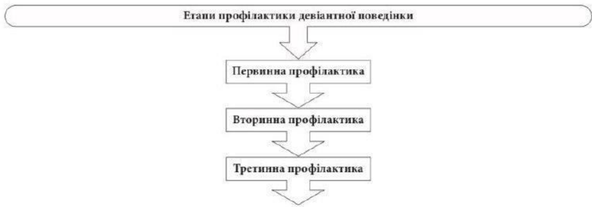
Рис. 1.1. Етапи профілактики девіантної поведінки (Мигдасюк, Демчук, Павлова, 2021).

На основі досліджень Мельничук О.Б. (2017) та Самойлова А.М. (2015), можна сказати, що три вищезазначені профілактичні етапи девіантної поведінки пов'язані між собою, але різняться за рівнем впливу відповідно до складності випадку. Первинна профілактика має більш інформативний характер, тобто інформування людей про наслідки негативних дій. Вторинна, у свою чергу - має обмежувальну дію, тобто обмежує поширення негативних явищ, зокрема, девіантну поведінку. І остання, третинна профілактика, спрямована на те, щоб розвивати стратегії поведінки, котрі входитимуть у межі загальноприйнятих норм.