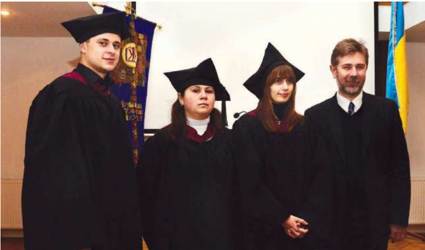
2013 р., 22 січня, Львів. У колі учнів – випусників магістерської програми з історії гуманітарного факультету УКУ