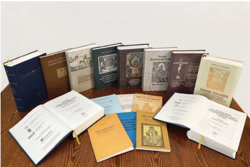
Книги Ігоря Скочилися

2022 р., 5 квітня, Львів. Друга меморіальна лекція Ігоря Скочилися