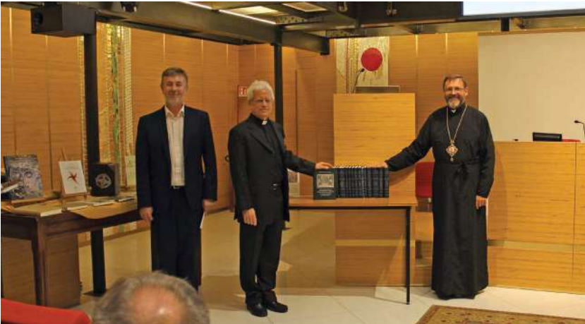
2019 р., 7 вересня, Рим. Представлення в Папському східному інституті 20 книг видавничої серії «Київське християнство»