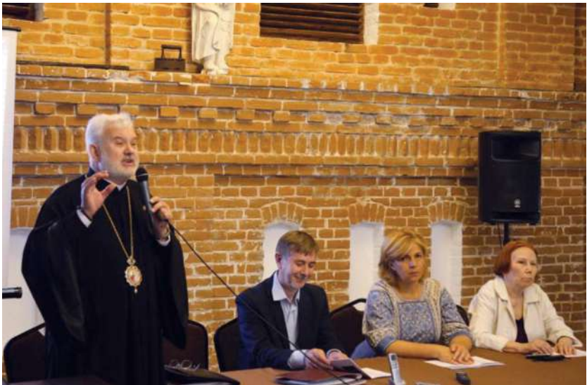
2016 р., 4 червня, Радомишль. Робочі будні наукової конференції