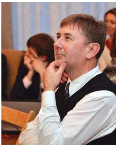
2014 р. Під час одного з навчальних семінарів