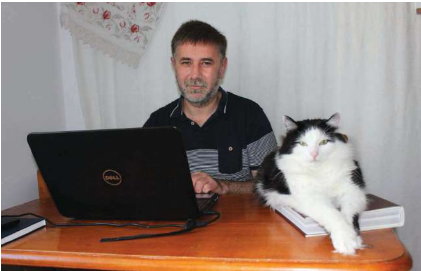
2015 р., літо, Львів. За робочим столом разом із домашнім котом