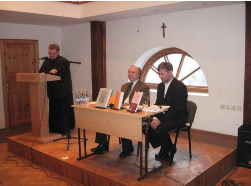
2008 р., Львів. Презентація авторських публікацій у конференц-залі УКУ на вул. І. Свенціцького