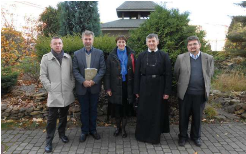
2013 р., жовтень, Перемишль (Польща). Учасники конференції з нагоди 1025-ліття Хрещення України-Руси