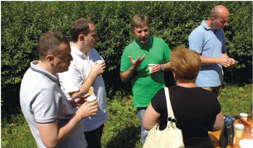
2013 р., червень, Крехів. Дружня розмова під час каво-перерви