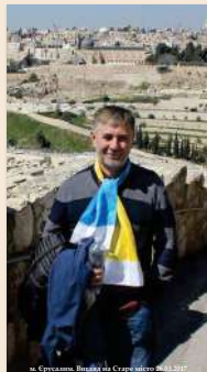
м. Супрасль, Висхід на Сторіжницю 2003.2007

Відбудеться онлайн 21 грудня 2021 р. на платформі zoom. Початок о 17.00