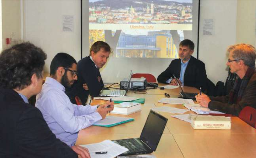
2015 р., 4 червня, Париж (Франція). Презентація програми «Київське християнство» у Вищій школі практичних досліджень (EHESS)