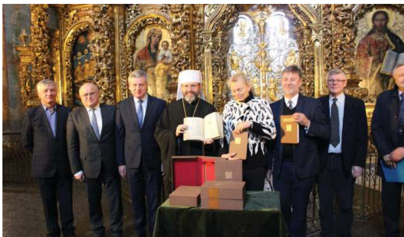
2018 р., 28 листопада, Київ. Презентація факсиміле Галицького Євангелія 1144 р. та наукового збірника «Духовна спадщина Давнього Галича» у храмі Софії Київської