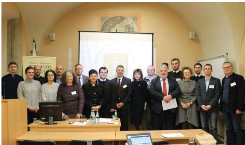
2017 р., 24 листопада, Вільнюс (Литва). На Міжнародній науковій конференції «Між західною та східною християнською традицією: вільнюська Троїцька святиня і монастир XIV–XIX ст.»