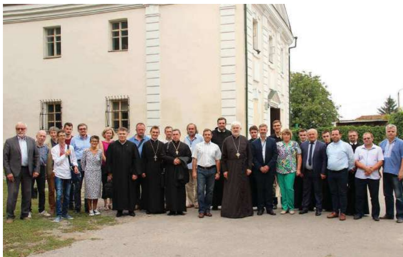
2018 р., 15 вересня, Умань. Учасники Міжнародної наукової конференції «Зцілюючи рани минулого: 1768 рік в історії України»