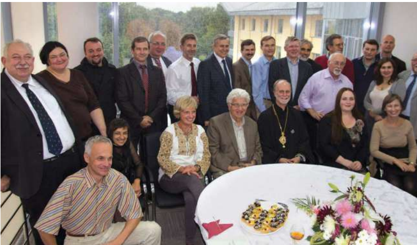
2013 р., вересень, Львів. Зустріч істориків з нагоди відкриття нового академічного корпусу гуманітарного факультету УКУ