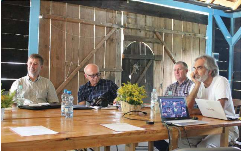
2016 р., 23 липня, с. Гораєць (Польща). Спікери літньої школи «Волинь, спільна культурна спадщина та поділена історична пам'ять»