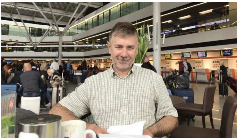
2018 р., вересень, Варшава (Польща). В аеропорту ім. Фридерика Шопена