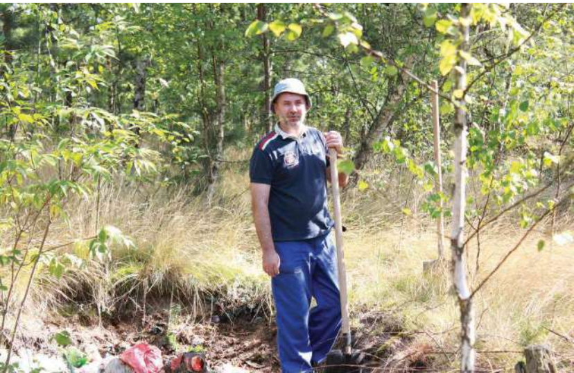
2014 р., липень, с. Гораєць (Польща). За працюю під час упорядкування українського цвинтаря