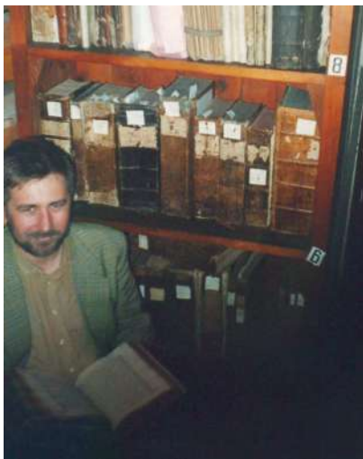
1996 р., Львів. У відділі рукописів Національного музею у Львові