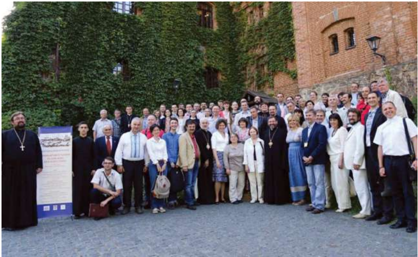
2016 р., 4 червня, Радомишль. Учасники Міжнародної наукової конференції з нагоди 400-ліття Житомирської унії 1715 р.