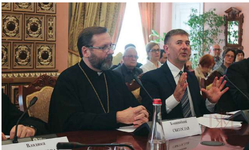
2017 р., 19 вересня, Київ. Презентація видавничої серії «Київське християнство» у Софії Київській