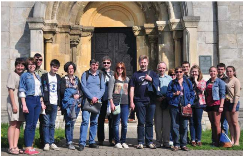
2014 р., 2 травня, с. Шевченкове (Івано-Франківська обл.). Учасники студентської навчально-історичної експедиції гуманітарного ф-ту УКУ