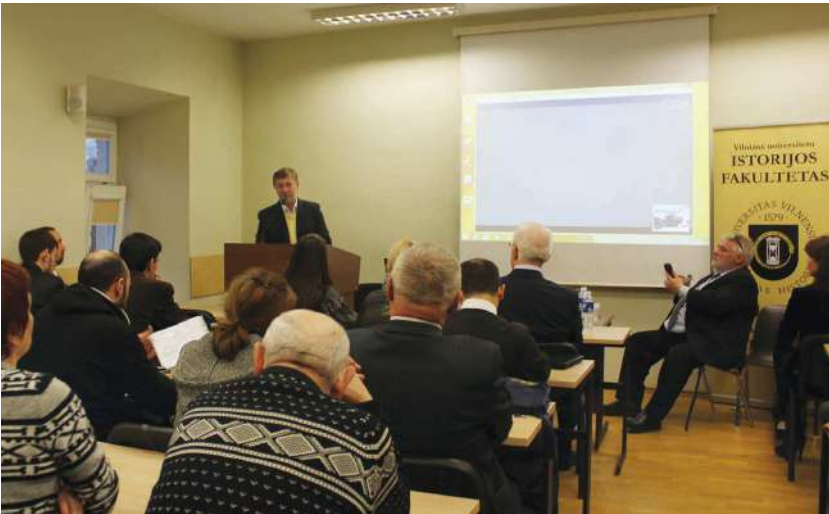
2016 р., 11 березня, Вільнюс (Литва). Доповідь на історичному факультеті Вільнюського університету