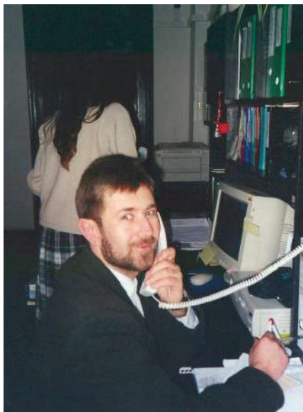
2002 р., Львів. За роботою в Інституті історії Церкви УКУ