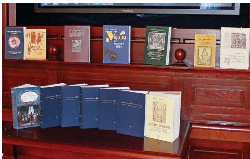
2017 р., 19 вересня, Київ. Видання серії «Київське християнство» у Софії Київській