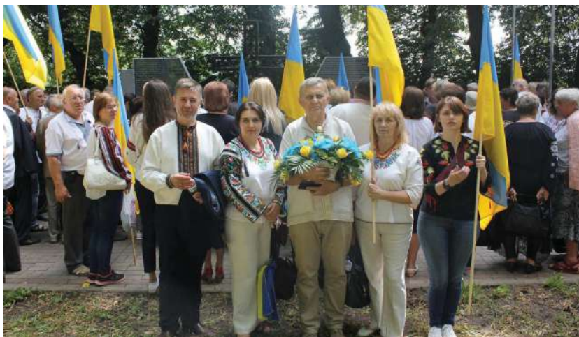
2018 р., 8 липня, с. Сагринь (Польща). Вшанування пам'яті українських жертв 1944 р.