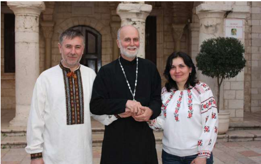
2017 р., 22 березня, Кана Галилейська у Святій землі. Обновлення подружньої присяги