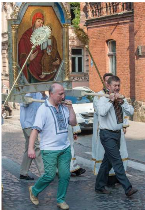
2016 р., вересень, Львів. Хресна хода вулицями міста з Ярославською чудотворною іконою Божої Матері «Милосердя Двері»