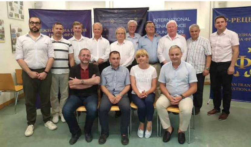
2019 р., 29 червня, Відень (Австрія). Члени журі Міжнародної премії імені Івана Франка в Інституті славістики Віденського університету