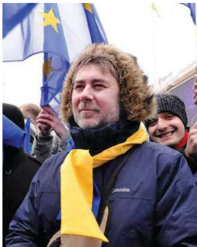
2013 р., листопад, Київ. Майдан. Революція гідності