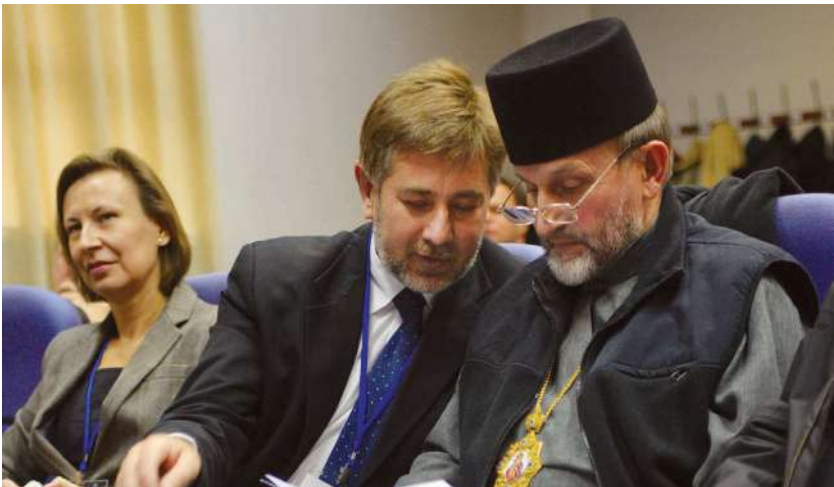
2013 р., листопад, Львів. Разом із митрополитом Ігорем (Возьняком) під час Міжнародної наукової конференції з історії Галицької митрополії