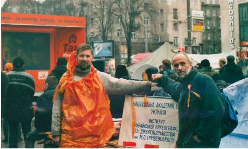
2004 р., листопад, Київ. У наметовому містечку на Майдані Незалежності під час Помаранчевої революції