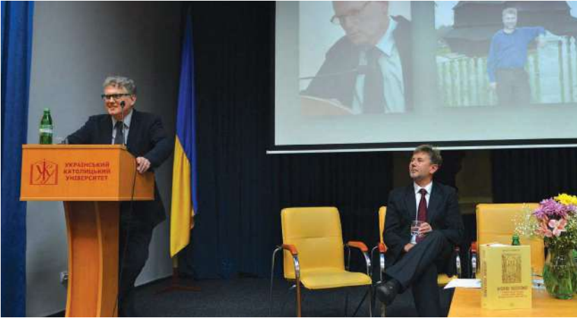
2014 р., 18 червня, Львів. Презентація монографії «Kościoły Wschodnie w państwie polsko-litewskim w procesie przemian i adaptacji: Metropolia kijowska w latach 1458–1795» в УКУ