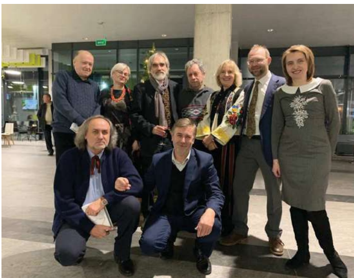
2020 р., січень, Львів. На святкуванні 60-річчя Ярослава Грицака