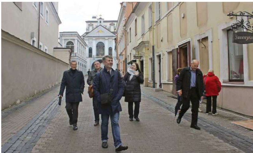
2018 р., 28 вересня, Вільнюс (Литва). Від Острої брами до храму Пресвятої Трійці разом із колегами