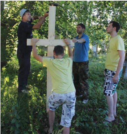
2016 р., 30 липня, с. Гораєць (Польща). Встановлення надмогильного хреста на місці масового захоронення українських жертв пацифікації села 6 квітня 1945 р.