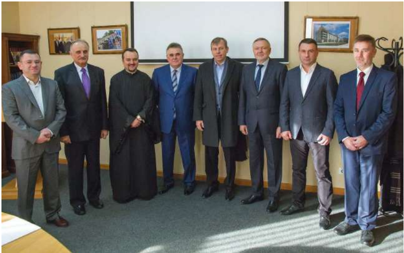
2015 р., грудень, Львів. Зустріч з українськими меценатами публічного проекту «Соборна Україна та Київська традиція»