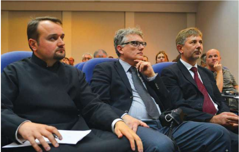
2014 р., Львів. У колі друзів та академічних партнерів