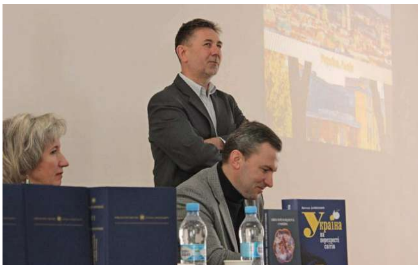
2018 р., 23 березня, Харків. Презентація видавничої серії «Київське християнство» у Харківському національному університеті ім. В. Н. Каразіна