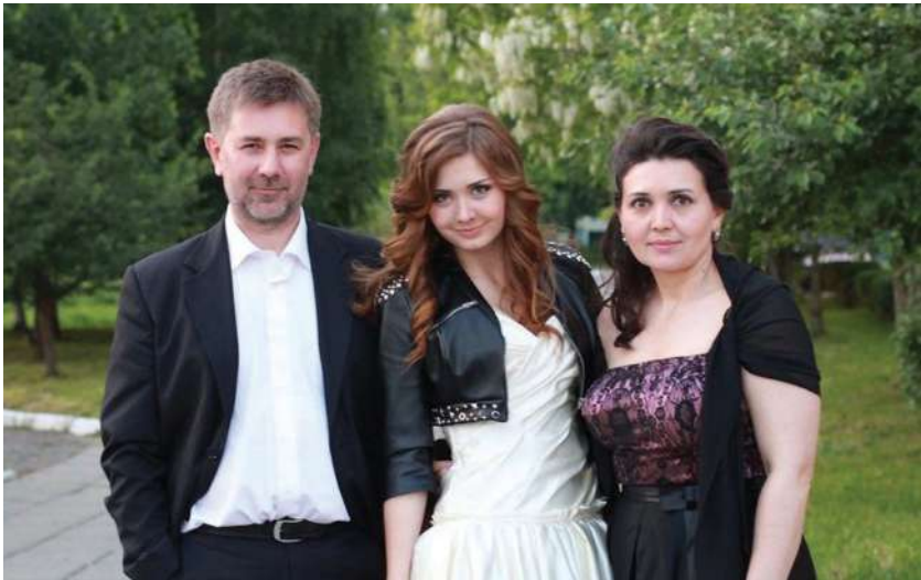
2011 р., Львів. Разом із сім'єю