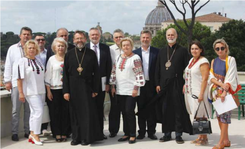
2019 р., 7 вересня, Рим (Італія). Українські меценати програми «Київське християнство» разом із Блаженнішим Святославом та митрополитом Борисом (Гудзяком) в Українській папській колегії святого Йосафата