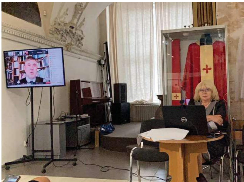
2020 р., 5 листопада, Львів. Виступ на XXX Міжнародній науковій конференції «Історія релігій в Україні»