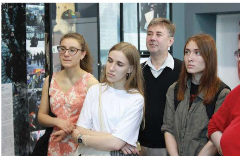
2019 р., 31 травня, Київ. Під час навчальної експедиції зі студентами УКУ в Національному музеї Революції Гідності