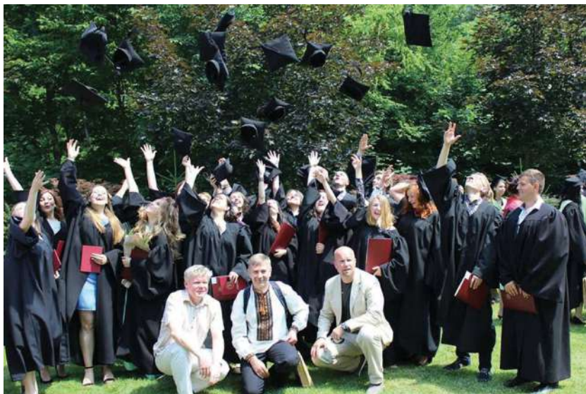
2016 р., червень, Львів. Випускні урочистості в УКУ