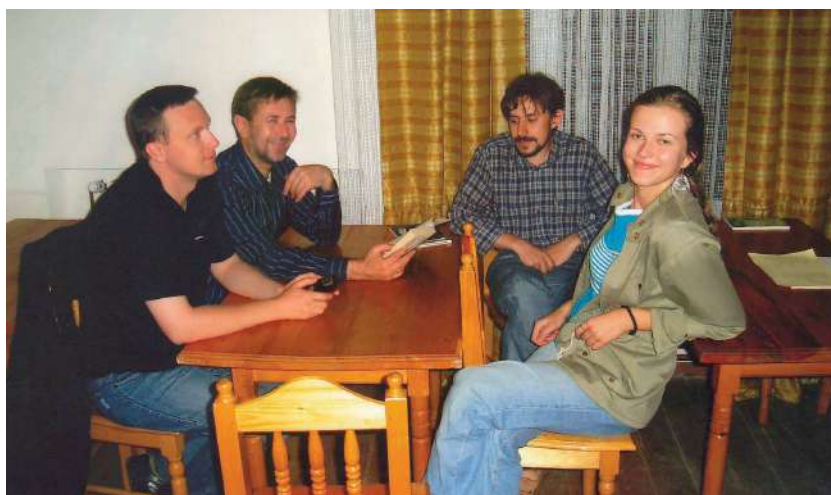
2007 р., червень, Унівський монастир. Разом з учасниками Унівської богословської школи