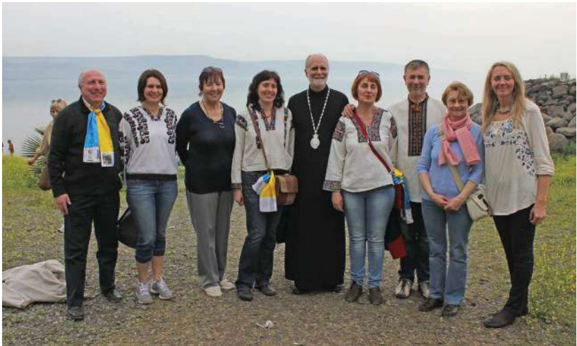
2017 р., 22 березня, Галилейське озеро у Святій землі. Співробітники Інституту історії Церкви