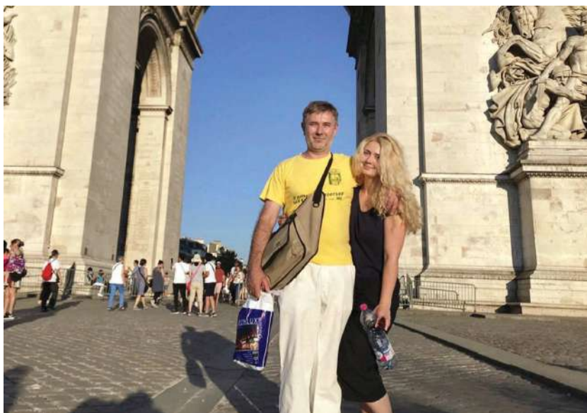
2018 р., 15 серпня, Париж (Франція). На відпочинку з донькою