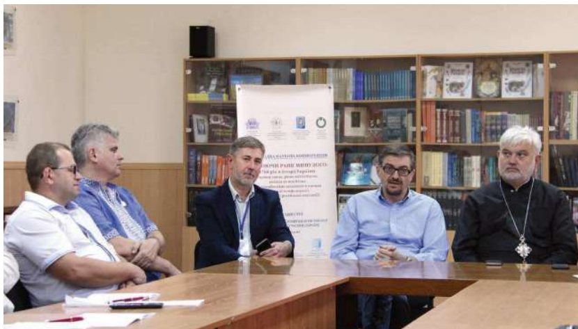
2018 р., 15 вересня, Умань. Публічна дискусія під час Міжнародної наукової конференції «Зцілюючи рани минулого: 1768 рік в історії України»