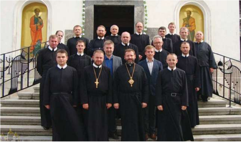
2013 р., вересень, Львів. Робоча зустріч із Блаженнішим Святославом (Шевчуком) та василіянами у справі дослідницької програми з історії Київської митрополії