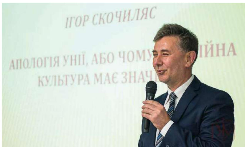
2017 р., 5 квітня, УКУ. Публічна лекція на тему «Апология Унії, або чому релігійна культура має значення» з нагоди 50-літнього ювілею