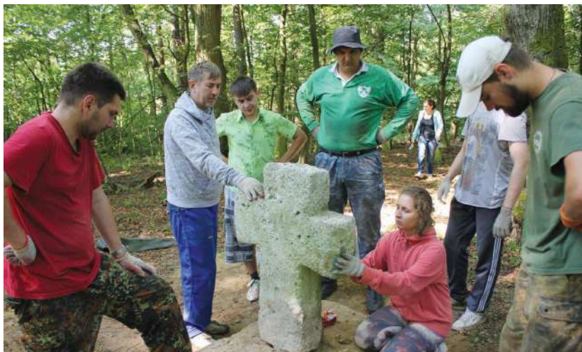
2016 р., 30 липня, с. Хотилуб (Польща). Відновлення хреста на занедбаному українському цвинтарі