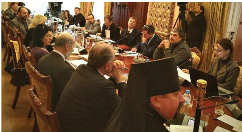
2019 р., 31 січня, Київ. Міжнародна експертна конференція «Юрисдикційний статус Київської православної митрополії у 1686 році: богослов'я, канонічне право та культурно-історичний контекст» у Софії Київській