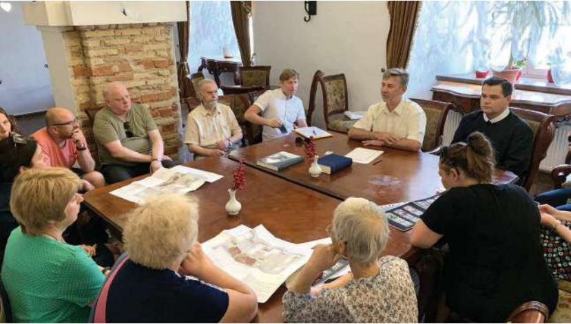
2019 р., 13 червня, Вільнюс (Литва). Представлення концепції вітражів василіянського храму Пресвятої Трійці у Вільнюсі, опрацьованої за участю програми «Київське християнство» в Міністерстві культури Литви