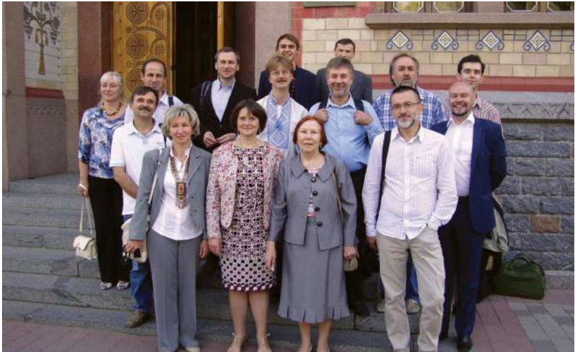
2015 р., 25 вересня, Полтава. Учасники Міжнародної наукової конференції «Суспільство Гетьманщини та Російська імперія»