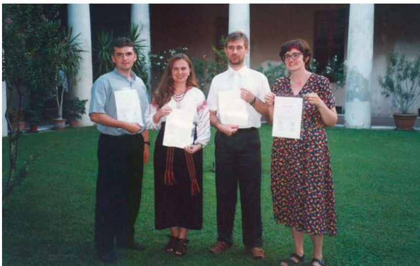
1999 р., липень, Мантуя (Італія). Учасники Літньої італомовної школи Вищого інституту релігійних студій ім. св. Франциска