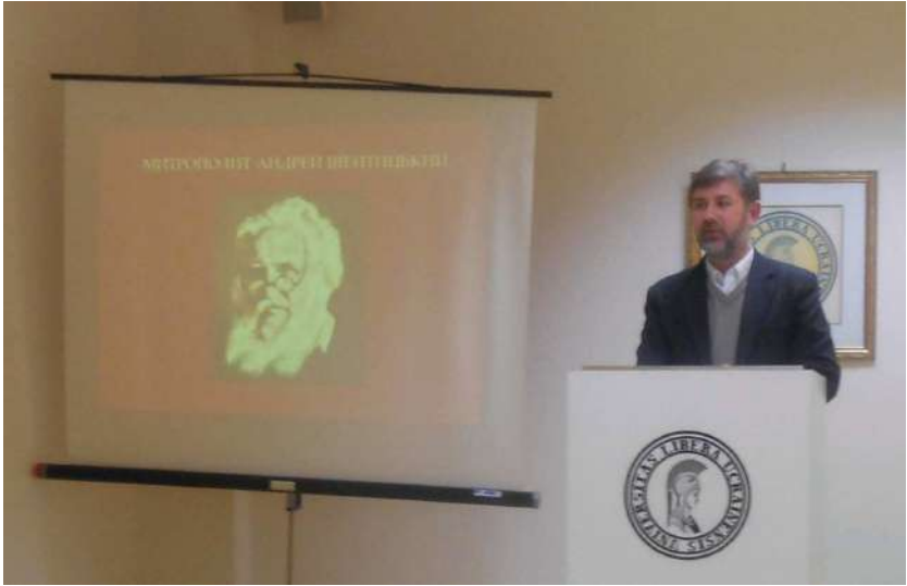
2013 р., 18 лютого, Мюнхен (Німеччина). Доповідь про Андрея (Шептицького) в Українському вільному університеті