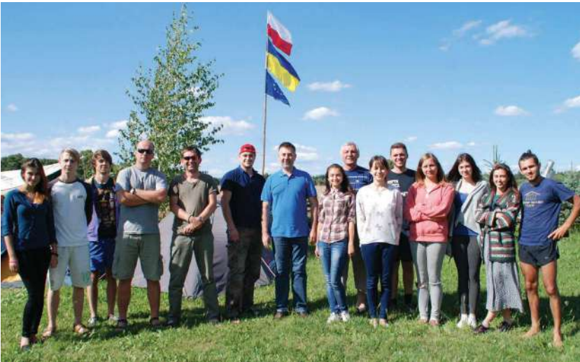
2015 р., липень, с. Гораець (Польща). Учасники навчально-історичної експедиції гуманітарного факультету УКУ