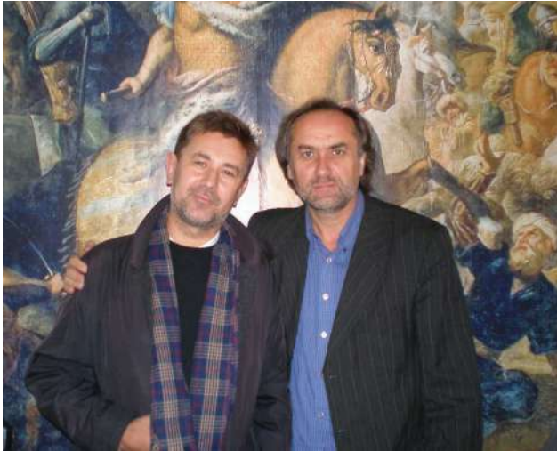
2009 р., 17 жовтня, Жовква. Учасники наукової конференції «Іван Мазепа і мазепинці: історія та культура України останньої третини XVII – початку XVIII століть»