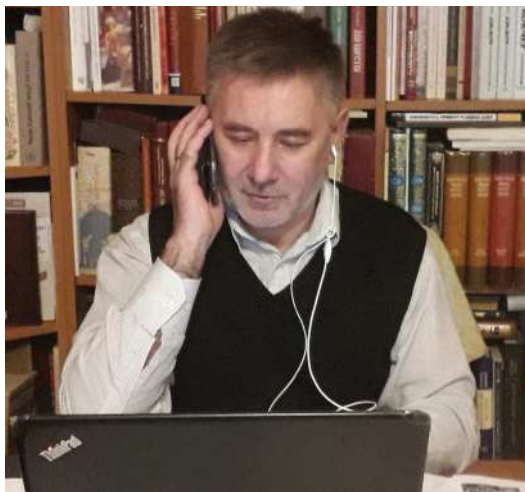
2020 р., 18 травня, Львів. Початок онлайн лекцій для студентів кафедри українознавства Ягеллонського університету (Краків, Польща)