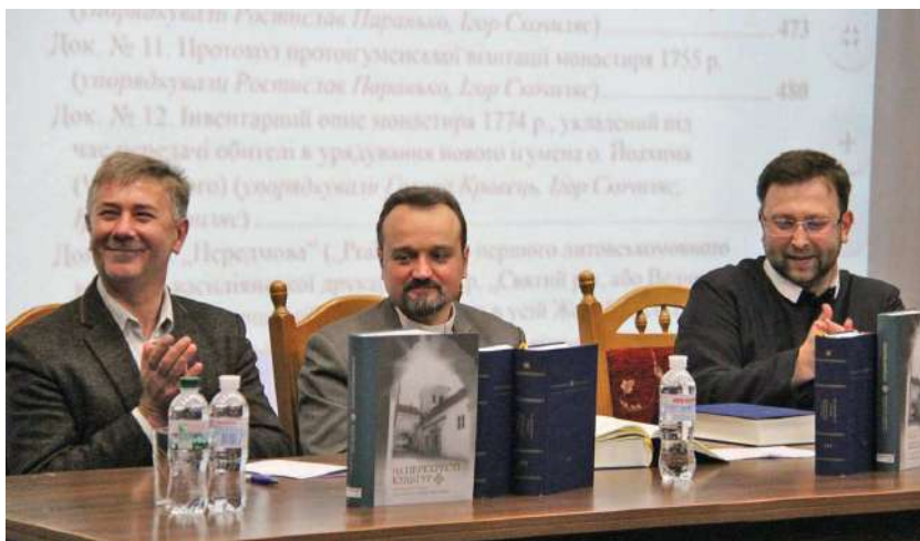
2019 р., 22 травня, смт Брюховичі. Презентація монографії українських і литовських науковців про Вільнюський монастир