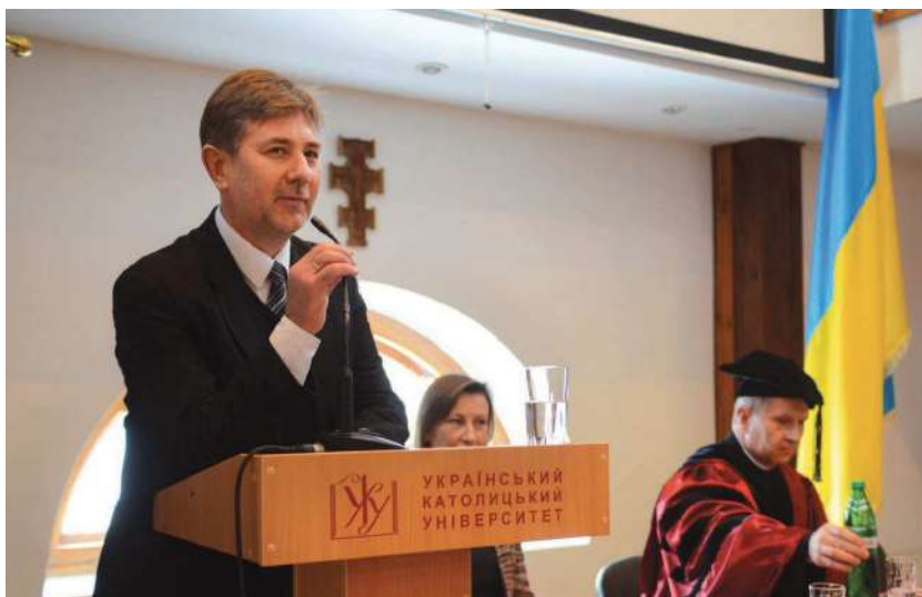
2014 р., січень, Львів. На випускних урочистостях магістрів-істориків