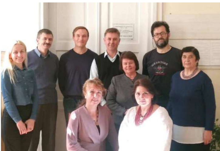
2019 р., 14 жовтня, Львів. У колі друзів у Львівському відділенні Інституту ІУАД ім. М. С. Грушевського