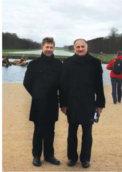
2012 р., грудень, Париж. Разом з «уківчанами» у Версалі