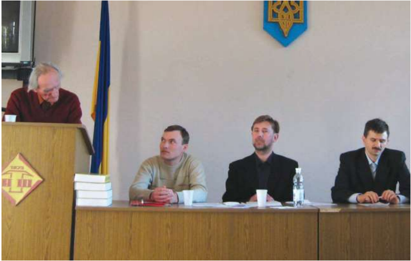
2007 р., вересень, Львів. Засідання Історичної комісії Наукового товариства імені Шевченка в Україні