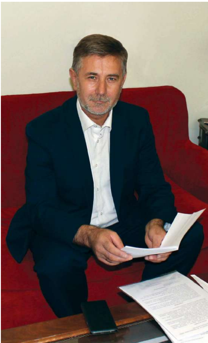
Рим, 7 вересня 2019 р.