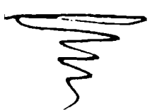
Автограф Тараса Шевченка Давидового псалому 149 Псалом новий Господеві

Що не міг я владати Якою мовою, Вона ж сама мене ібуче Серцем перемовила Во всім тілі моїй і в душі Востанок благоді, Діла моя і діла твої Провести поспішаю Чути надобилося востанок В усіх моїх ділах і в ділах твоїх Радує мене слово твоє Діла твої і діла твої, Діла твої і діла твої Відаючи отому Як в усіх моїх ділах і в ділах твоїх Окрім тебе не було нікого Відомого мені. І всі мої діла і діла твої Рухалися окремими І судилися суботними Сідали своїми силами. І в усіх моїх ділах і в ділах твоїх Відомою мовою.