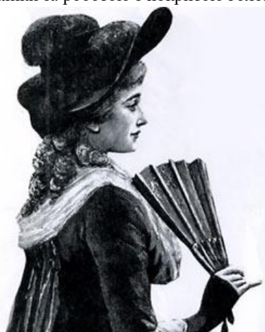
Зображення 3. Жінка з капелюшком, Англія, 1800-ті рр.