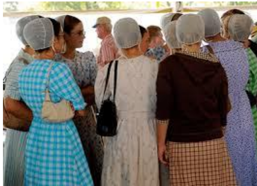
Фото 8. Спілкування жінок-менонітів, сучасність.