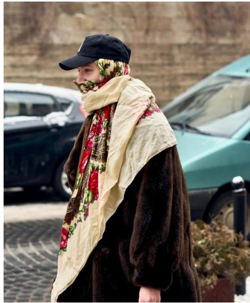
Фото 10, 11. Дівчата у хустках, Львів, 2022 рік.