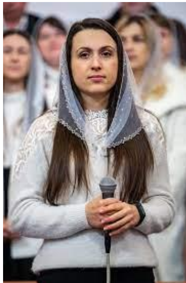
Фото 5. Жінка під час зібрання у п'ятдесятницькій церкві ХВС в м. Івано-Франківськ, сучасність