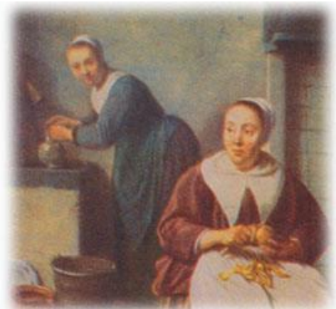
Зображення 2. Анабаптистські жінки за роботою з покритою головою, Нідерланди, 1600-ті рр.