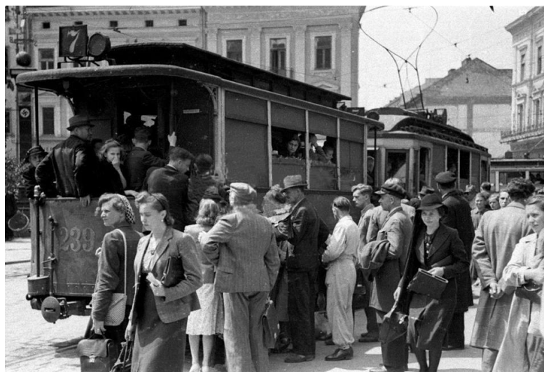
Фото 13. Жінки та деякі чоловіки в головних уборах, Проспект Свободи, початок 1940-х рр.