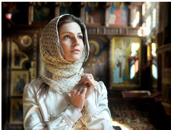
Фото 6. Православна жінка з покритою хусткою головою, сучасність.