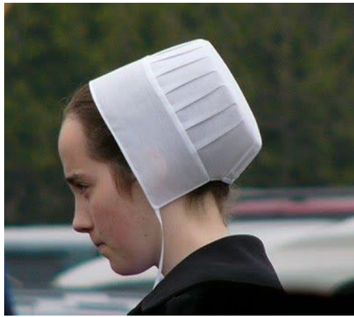
Фото 7. Молода дівчина-аміш у покритті, сучасність.