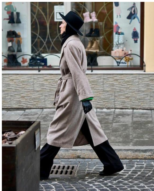
Фото 12. Жінка в капелюшку, Львів, 2022 рік.