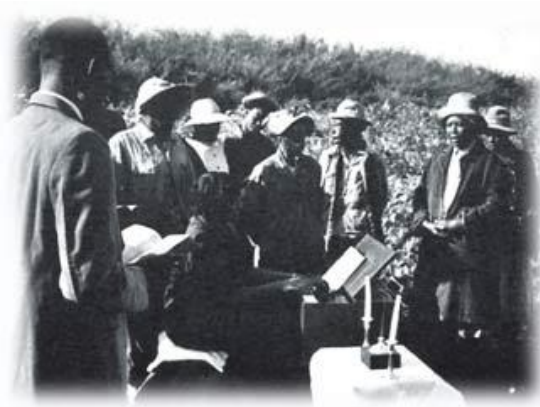
Фото 4. Африканські баптисти в Америці, хрещення, 1953 р.