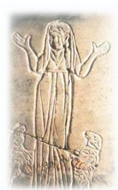
Зображення 1. Жінка молиться з покритою головою, Катакомби Рима, 200 р.