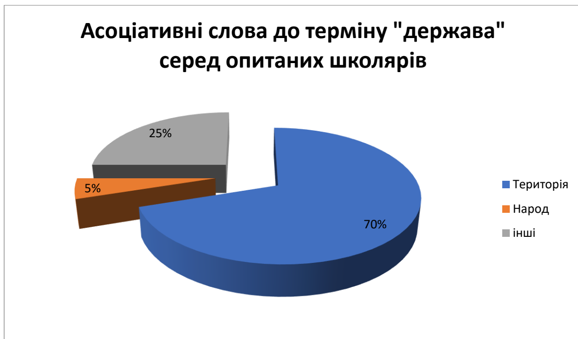
Рис. 3.1. Розподіл відповідей серед опитаних учнів щодо асоціації з терміном «Держава»

асоціюється слово «держава». Загальна кількість опитаних учнів – 270. За результатами опитування лише 5% школярів асоціювали слово «держава» зі словами «народ», «нація», «ми». 70% відповіли що для них «держава» це - «територія». Решта 25% відповідей містили слова «влада», «герб», «прапор» та ін. (Рис.3.1)