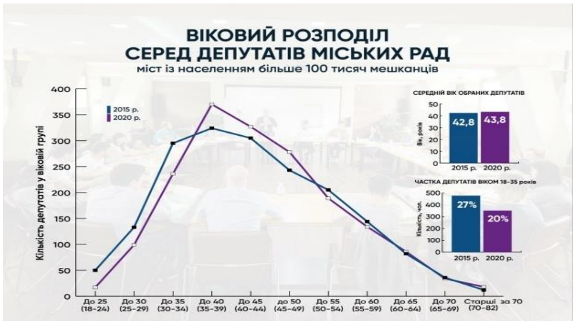
Рис.2.3. Віковий розподіл серед депутатів міських рад міст із населенням більше 100 тис. мешканців. Складено за даними дослідження центру «Ейдос» та дослідницької агенції «Фама» у партнерстві з представництвом фонду К. Аденауера в Україні [22]

Інша ситуація з депутатським корпусом. Чинним законодавством не передбачено заробітну плату для депутатів місцевих рад. А відтак, це суттєво впливає на мотивацію молодих людей балотуватись на місцевих виборах. Більше того, за результатами місцевих виборів 2020 року у порівнянні з 2015 роком зменшилась частка депутатів віком з 25 до 35 років в загальній віковій структурі місцевих рад (рис. 2.3.). [22]