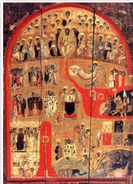
Страшний суд, XI-XII ст. Монастир св. Катерини, Синай

Це традиція тільки Східної Церкви, яка пов'язана із вченням про митарства. Вважають, що після розлучення душі й тіла, душа до третього дня перебуває поблизу від плоті, на землі. Після цього вона йде по митарствах. І тут є розбіжності: згідно з одним уявленням душа митарствує до 9-го дня, згідно з іншим - до 40-го. На 40-й день предстає перед Господом, тоді ж одержує остаточний вирок щодо її стану до воскресіння. Існує думка, що до 9-го дня душа в супроводі з ангелами зустрічається з демонами на митницях, а після цього мандрує самотійно. Різні агіографічні джерела кажуть, що у проміжку між 9-м і 40-м днем вона може відвідати ад і рай.