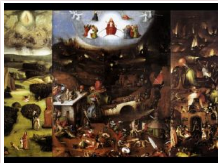
Босх І. Страшний суд, бл. 1504. Академія образотворчих мистецтв, Відень

Вчення про митарства частково представлені в Орігена, в житті Антонія Великого, Псевдо-Макарія, найбільш яскраво - у Кирила Александрийського. Розширене це вчення в агіографії Василя Нового й об'явленні блаженної Теодори. Остання розказує, що митарств є 20: коли душа відплатить кожному митнику, тоді зустріється з Ісусом Христом. Єдиний метод, яким можна зменшити кількість гріхів, за які треба розплачуватися, - це щирість покаювання за кожен з учинків за життя. Приклад і водночас доказ цього - розбійник Варнава, який, будучи поруч із Христом на розп'ятті, покаювся і попросив пом'янути його в Царстві. І почув у відповідь: «Ще сьогодні увійдеш зі Мною до раю».