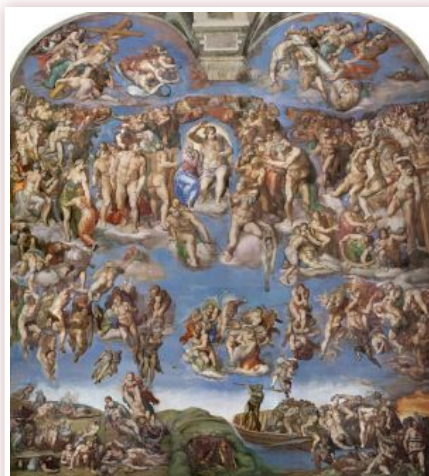
Мікеланджело Страшний суд, бл. 1537-1541. Сикстинська капела, Ватикан

Варто пам'ятати про три «solo» Мартіна Лютера, за допомогою яких можна спастися і прийти в Царство Боже: перше - тільки Святе Письмо, друге - тільки ласка Божа, третє - тільки віра. Всі інші намагання і зусилля, як, до прикладу, сповідь, покаювання тощо були ніби виявом зухвалості людини, яка вважає, що може якось вплинути