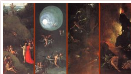
Босх І. Рай і пекло. Земний рай. Вознесіння праведних. Падіння грішників. Пекло

Тут теж ведеться суперечка. Різниця між Католицькою і Православною Церквами полягає в тому, чи після смерті вже є повнота мук чи блаженства. Бо згідно із визначенням католиків після Флорентійського собору 1438 року ті, хто помирають у стані тяжкого чи первородного гріха, відразу сходять до пекла, а праведники відразу йдуть до неба в повноті блаженства. Натомість Східна Церква в лиці Марка Ефеського говорила на цьому соборі, що не вірить у повноту мук чи блаженств відразу після смерті. Адже стан від смерті до воскресіння - це стан очікування Страшного суду, після якого в цілісності душі й тіла ми зможемо відчувати повноту.