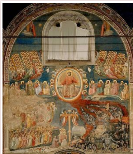
Джотто Страшний суд Каплиця Скровень в Падуї, Італія

У цьому є доля правди. Не так давно у католицькому середовищі вважали, що нехрещені діти потрапляють у так зване лімбо, де вони не зазнають вічних мук, але позбавлені можливості споглядання Бога. Ось своєрідне полегшення за «несвідомість» гріха: замість вічних мук - неможливість бачити Бога, неповнота блаженства.