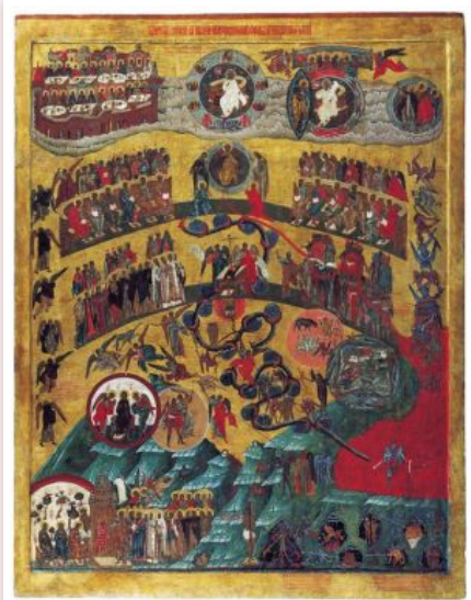
Страшный суд, 1580