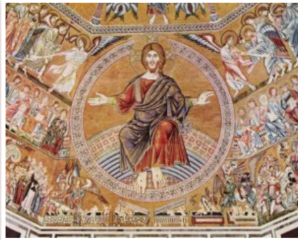
Христос Пантократор і Страшний суд, 1300. Баптистерій Сан Джованні у Флоренції, Італія

літургійних текстах. Найбільшою напругою, звичайно, для мене залишається питання спасіння усіх. Це - виклик для есхатології. Напруга в тому також, що тут не можна дати вичерпних відповідей, як і у тринітарному богослов'ї. Чи можемо ми пояснити внутрішньотроїчне життя? Достеменно - ні, бо це теж таїнство. Людина ніколи не зможе ці таїнства осягнути своїм розумом. Навіть об'явлення святим Царства Небесного не можна вважати безпечним джерелом, бо кожному було дано побачити відповідно до його рівня і можливостей сприйняття, в його культурному контексті, відповідно до його світосприйняття.