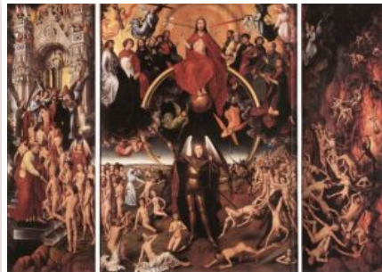
Мемлінг Г. Страшний суд, бл. 1461-1473. Поморський музей, Гданськ

Анафема - це відлучення від спілкування з Церквою. Якщо хтось помирає під анафемою, це не означає, що ця людина повинна перебувати в пеклі. Бо ніхто не може знати, чи в останню хвилину перед смертю єретик, атеїст чи будь-який інший противник Церкви не покався.