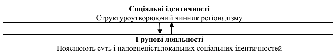
Рис. 1. Схема взаємозв'язку між концептами “соціальна ідентичність” і “групова лояльність” у рамках дослідження регіоналізму

обох міст [2, с. 11–13], у 1994 та 2010 рр. і у Львові, і в Донецьку національна ідентичність “українець/ка” входила в п’ятірку найпопулярніших. У 2015 р. ситуація дещо змінилась: у Львові ідентичність “українець” була на першому місці, а в Донецьку вона опинилась на 8-му місці, проте й надалі входила в десятку найбільш опуклих.