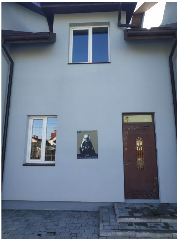
Кімната-музей владика Володимира Стернюка у м. Пустомити 291 .