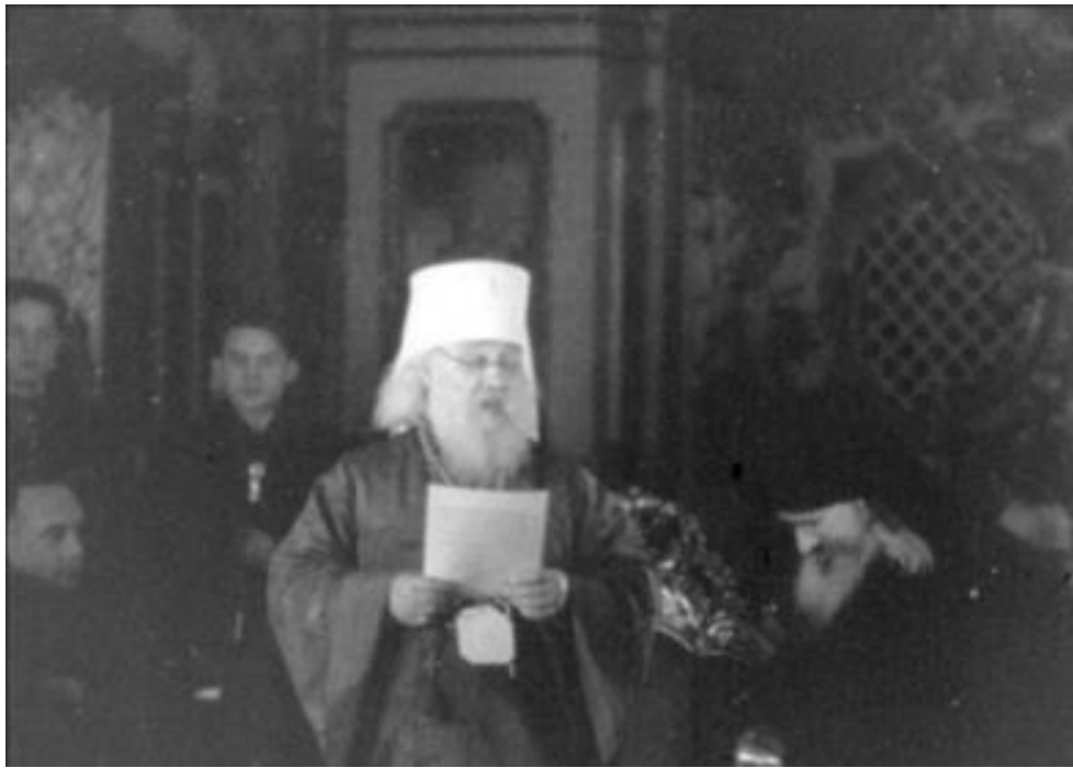
Екзарх України Іоан зачитує учасникам Собору телеграму Патріарха московського і всієї Русі Алексія. 9 березня 1946 року 284 .