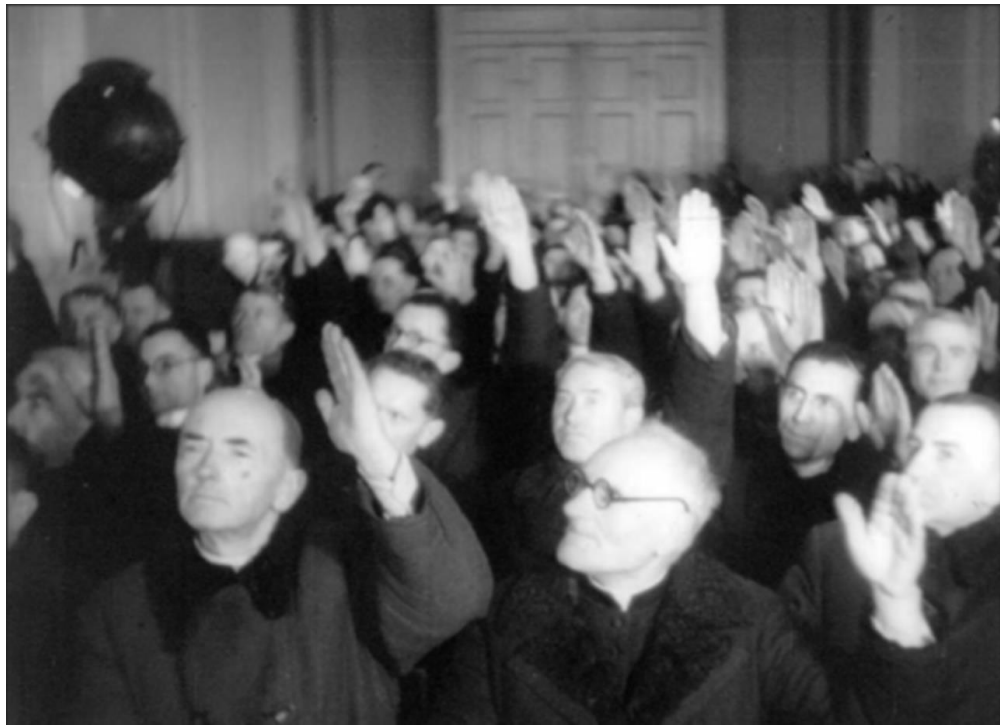
Голосування учасників Львівського собору. 8 березня 1946 року 282 .