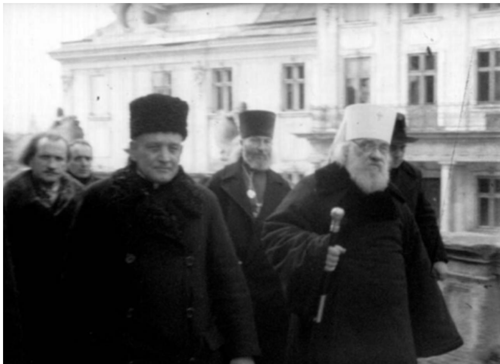
Прибуття екзарха України Іоана до собору св. Юра. 9 березня 1946 року 283 .