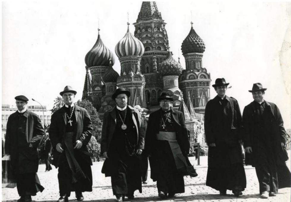
Українські греко-католицькі єпископи на Червоній площі у Москві. 1989 рік 289 .