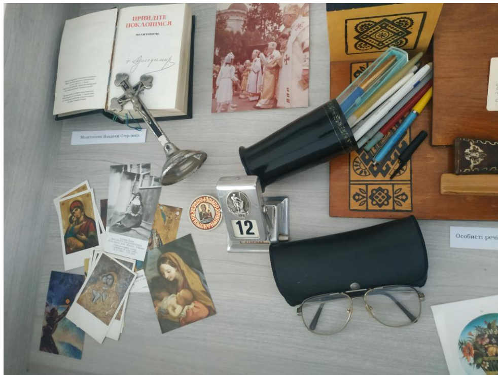
Особисті речі владика Володимира Стернюка 292 .