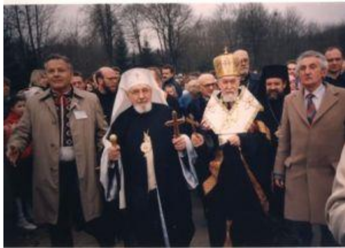
Повернення Глави УГКЦ Блаженнішого Мирослава Івана Любачівського. Львів, 1991 р. 290