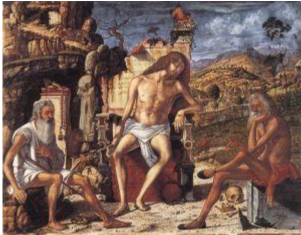
В.Карпачіо.Роздуми над стражданнями. 1510 р

Звернімося тепер до біблійної розповіді про Йова, в якій є вагома корекція таких поглядів: