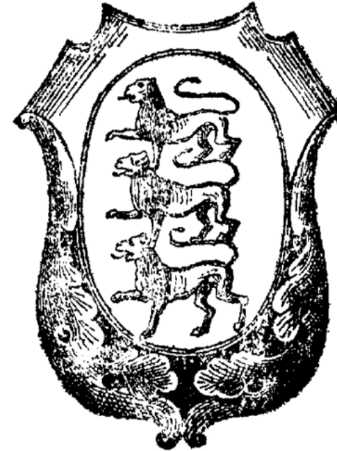
Рис. 1. Герб Жидачівського князівства (Baliński M., Lipiński T. Starożytna Polska pod względem historycznym, geograficznym i statystycznym. – Warszawa, 1885. – Т. 2. – С. 758; Niesiecki K. Herbarz Polski. – Lipsk, 1839. – Т. I. – С. 173–174).

tenucionis et gubernacionis oppidi Zydaczow» 17 . Хоча деякі науковці вважають, що цю грамоту слід датувати ранішим часом, бо інших документальних свідчень перебування Свидригайла в Жидачівських землях у той час ми не маємо.