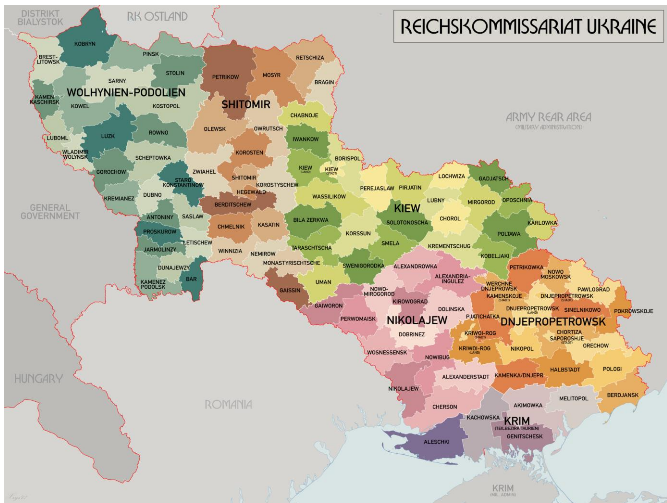
Додаток 1. Карта Райхскомісаріату «Україна».