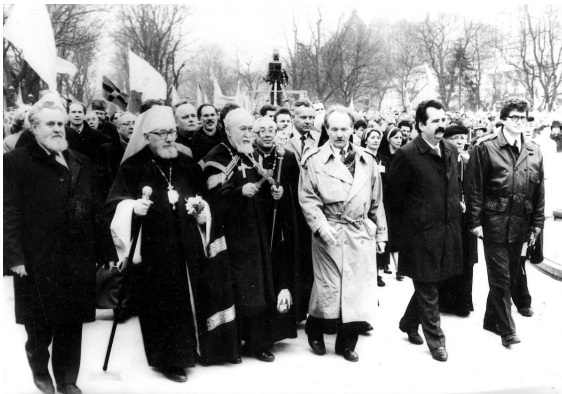
Рис. № 7 Повернення Блаженішого Мирослава Івана Любачівського до м.Львова, 1991 рік