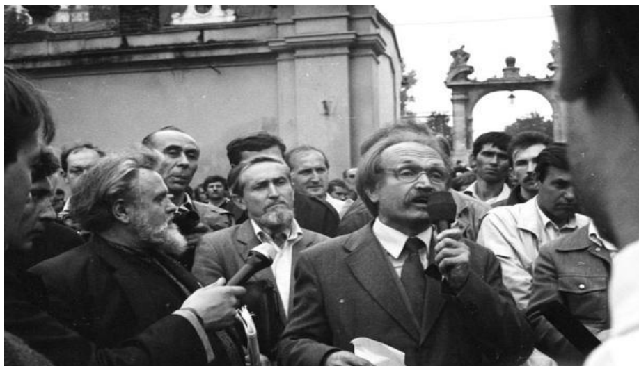
Рис. № 4, 5, 6. Похід за легалізацію Української Греко-католицької Церкви (17 вересня 1989 року) 382