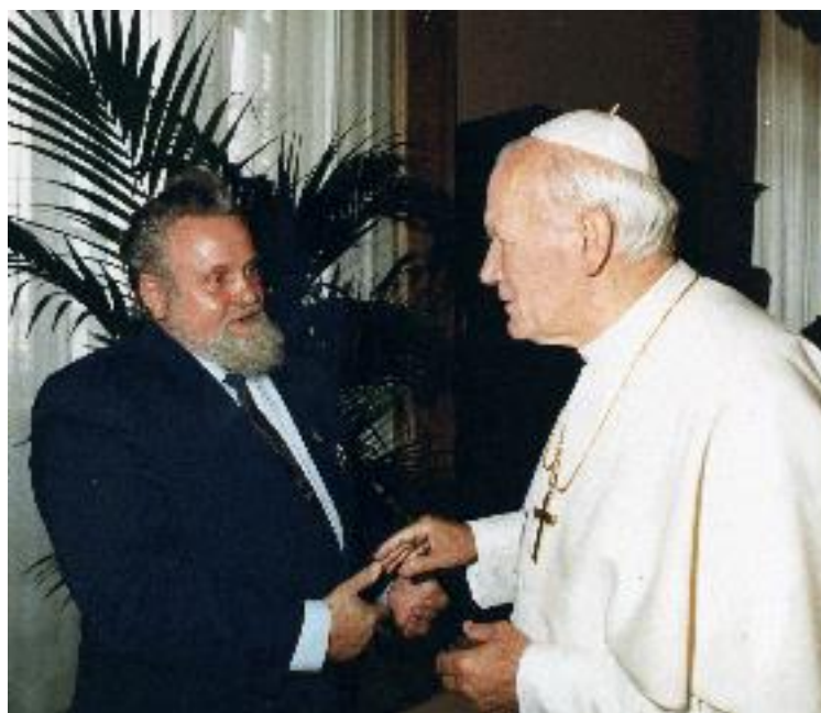
Рис. № 8 Аудієнція у Папи Римського Івана-Павла II (липень 1990 року)