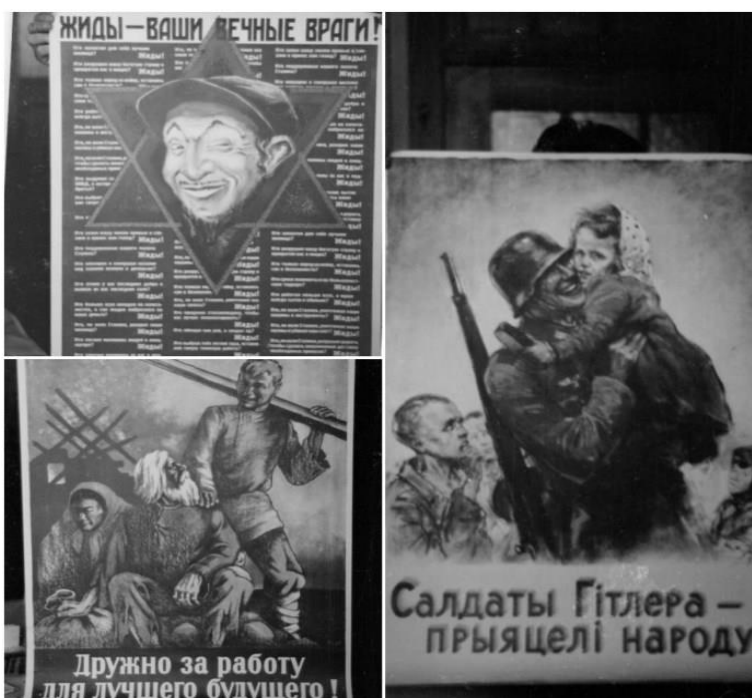
Мал. 3. Нацистські пропагандистські плакати, надруковані у Львові 1943 року 3