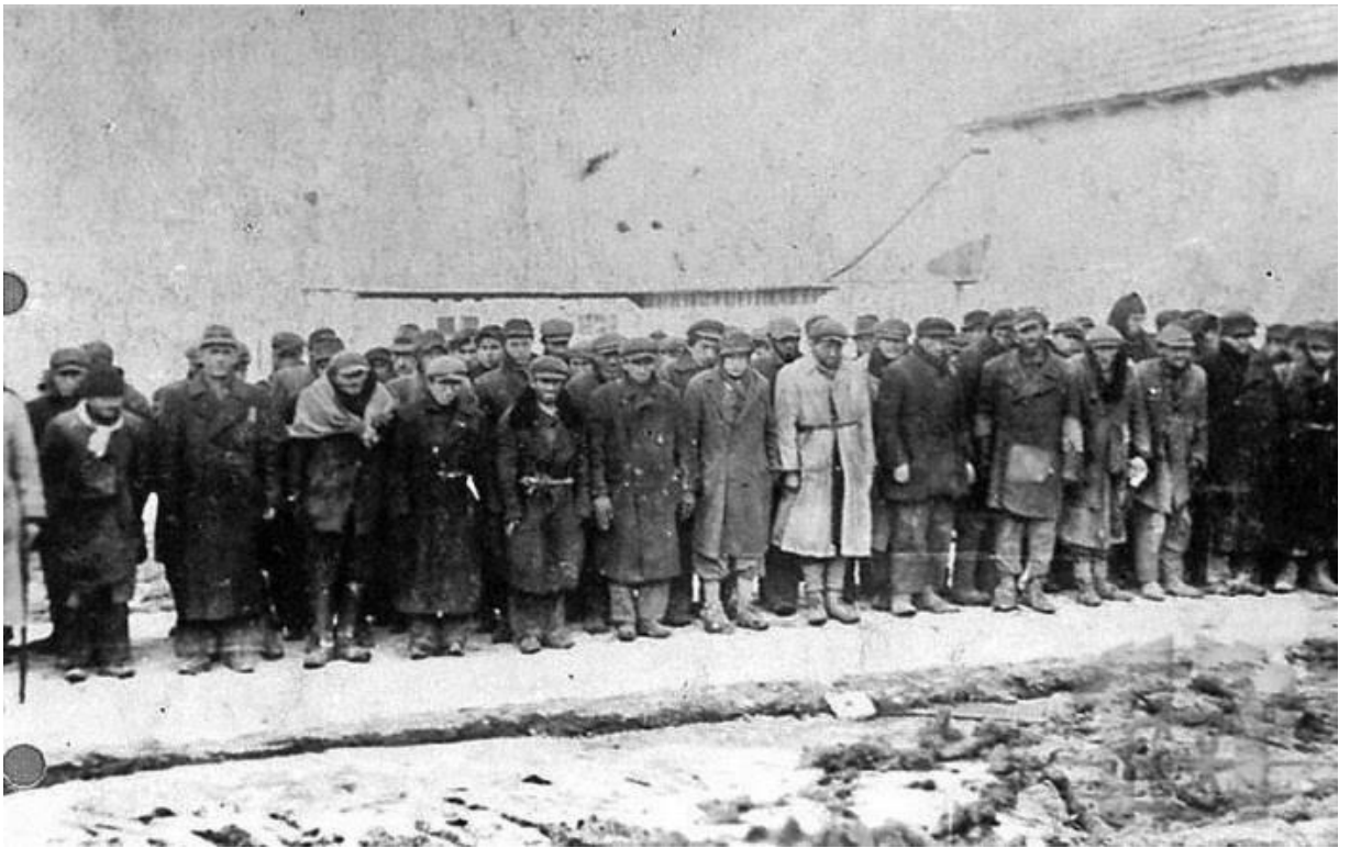
Мал. 4. В'язні Янівського концтабору 4