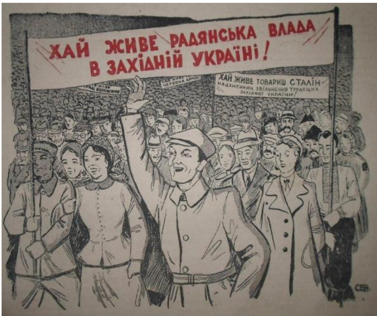
Мал. 1. Ілюстрація з радянського видання «Вільна Україна» (Львів), жовтень 1939 року 1