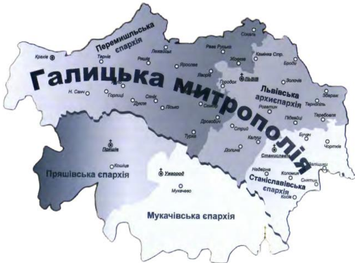
Карта Галицької митрополії Греко-Католицької Церкви 1