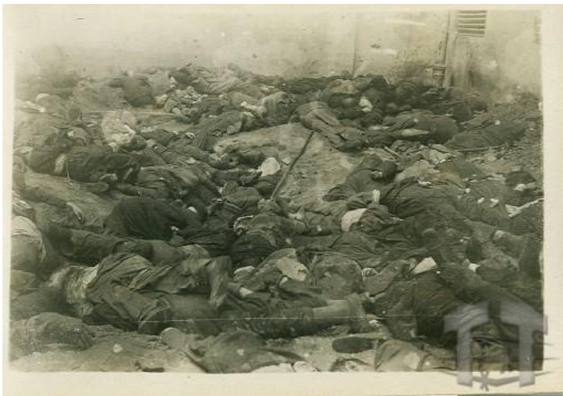
Мал. 2. Тіла жертв НКВС на подвір'ї тюрми «Бригідки» 2