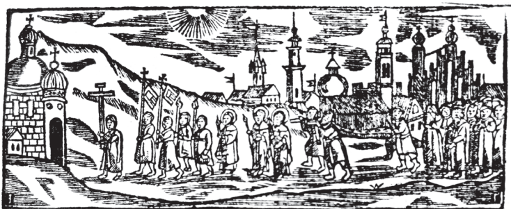
Похоронна процесія на передмісті Львова перед Миколаївською церквою (заставка Івана Глинського у Требнику 1668 р.)

віри звернула увагу на надуживання, пов'язані з незаконним побиранням столового в унійних парафіях Мараморощини. Римські кардинали навіть ініціювали канонічний процес між єпископами Мукачева та Фогарашу, які сперечалися між собою за контроль над катедратиком у цьому регіоні. 1738 року, у зв'язку з хіротонією нового владики Гавриїла (Блажовського, 1738-1742), австрійський імператор Леопольд підтвердив своїм дипломом право мукачівських святителів отримувати від підлеглого їм духовенства церковні податки 112 .