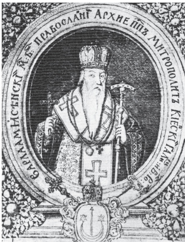
Київський православний митрополит Варлаам (Ясинський)