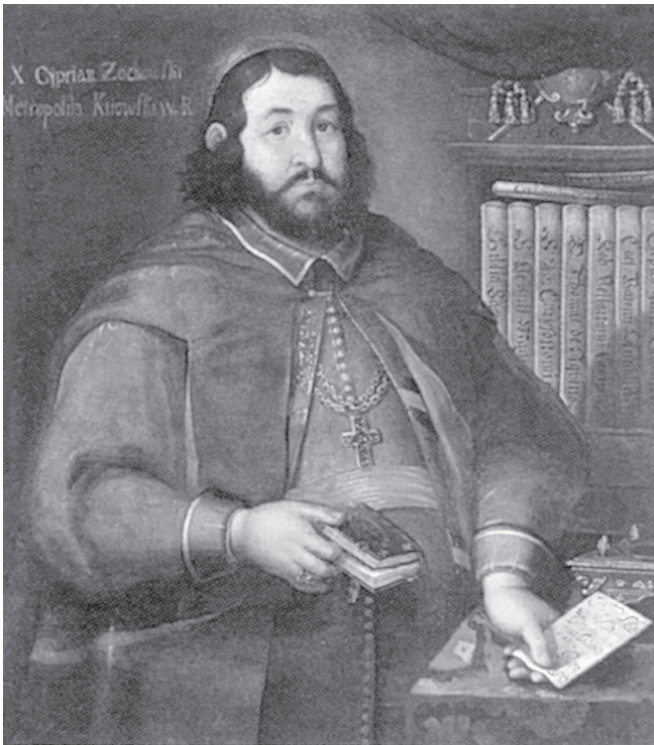
Київський унійний митрополит Киріан (Жохівський)