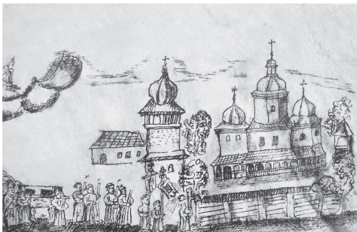
Церква Успення Пресвятої Богородиці в м-ку Олесько Луцько-Острозької єпархії (малюнок з парафіяльного пом'яника). 1728 р.

царській адміністрації на Лівобережній Україні в 60–80-х рр. XVIII ст. – у рамках секуляризаційної реформи. Саме таким чином на порозі модерної доби Руська Церква звільнилася від «тягару катедратика», проте зробила вона це не з власної волі, що негативно позначилося на внутрішній консолідації духовенства в умовах політичної нестабільності й поділів українсько-білоруських земель між Австрією, Пруссією та Росією. Це певною мірою також спричинилося до «швидкого падіння» в кінці XVIII – першій третині XIX ст. на Брацлавщині, Волині, Київщині, Поділлі й частині в Білорусі «Золотого Колосу Русі» – Київської унійної митрополії.