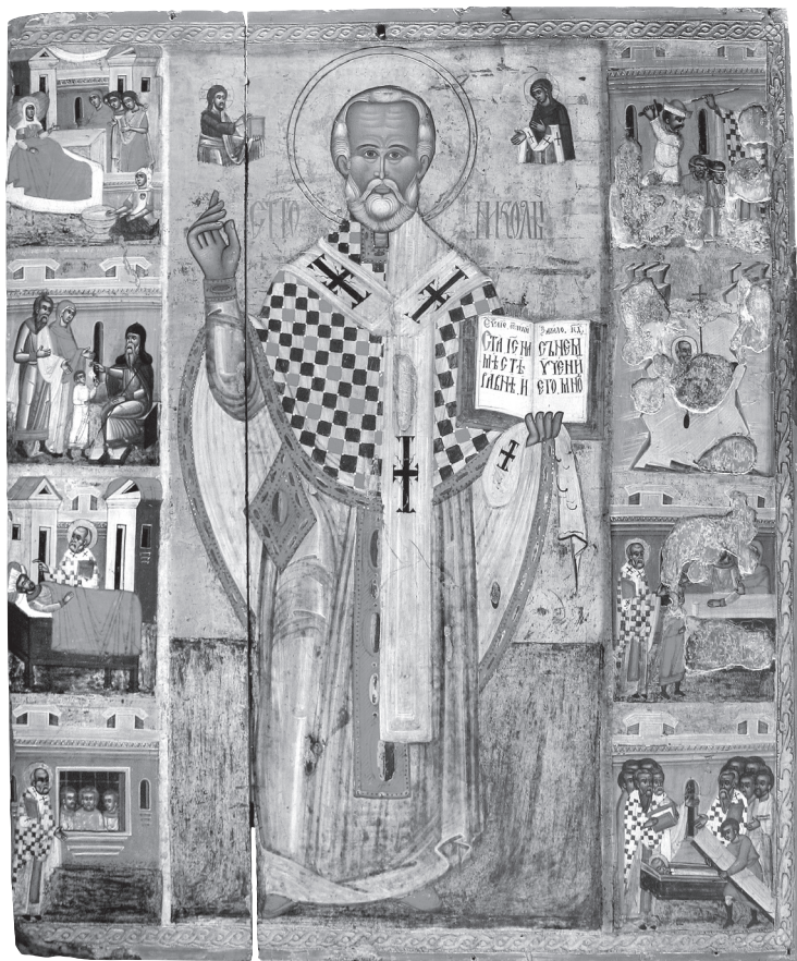
Святий Миколай з житієм. 1560-ті рр. (з церкви Різдва Богородиці в м. Долина на Прикарпатті)