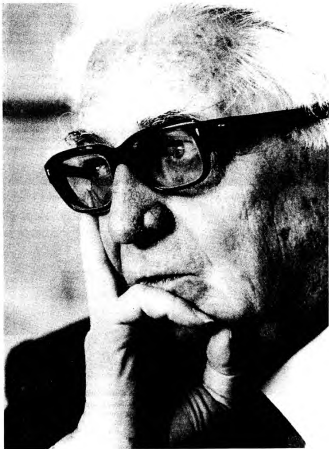
Фернан Бродель у останні роки життя