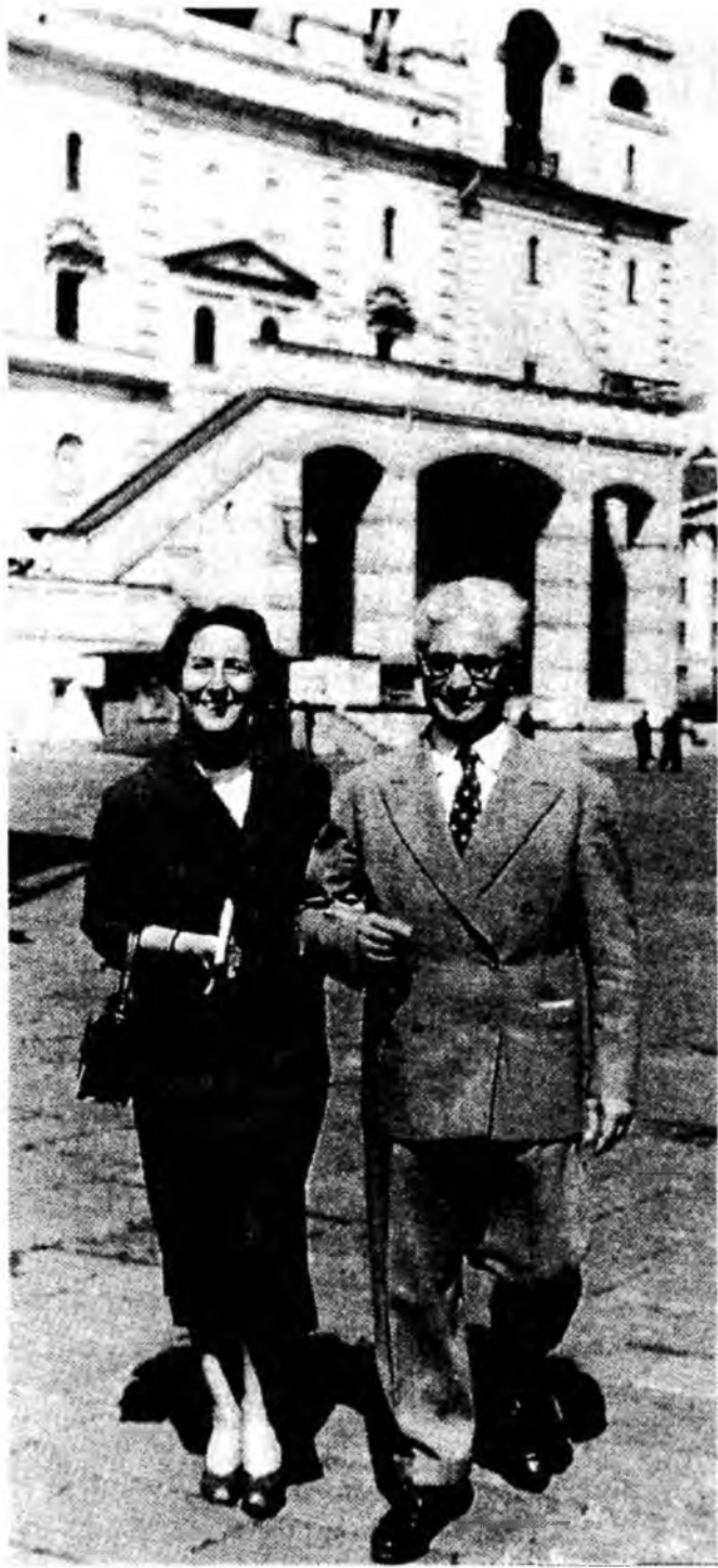
Подружжя Бродель у 1960-ті роки