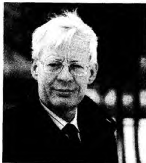
Емманюель Ле Руа Лядюрі