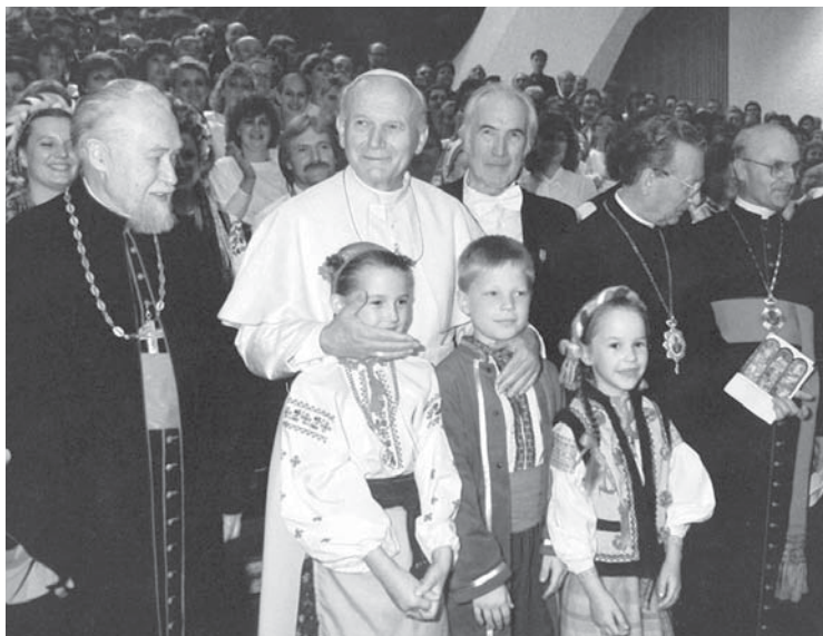
Папа Іван Павло II, кард. Мирослав Любачівський, Мирослав Антонович у Римі після концерту до 1000-ліття Хрещення Руси-України (1988)

Український католицький університет Гуманітарний факультет Інститут церковної музики