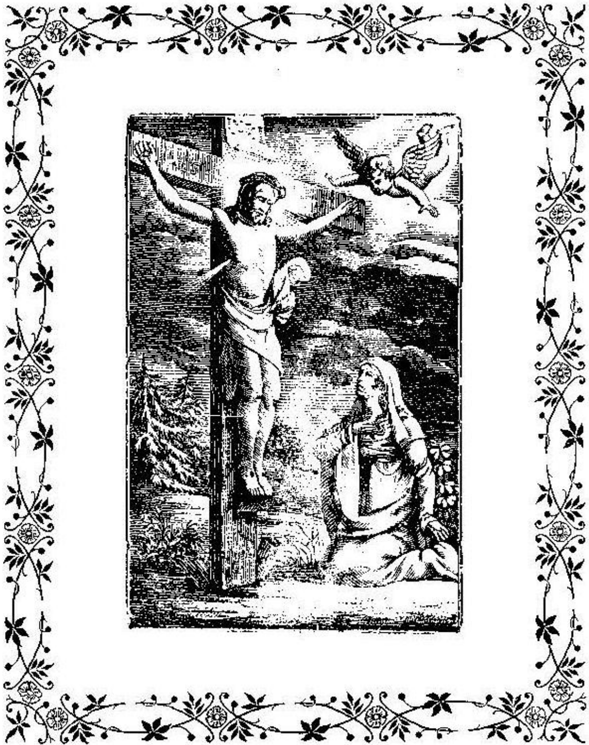
Плач Богородиці під хрестом 1