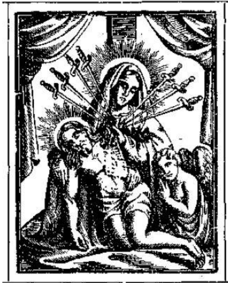
Мечи болю Богородиці 1