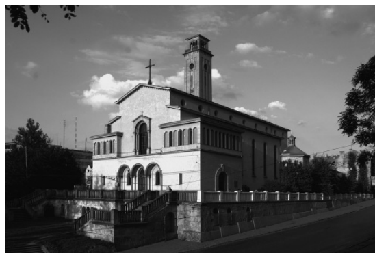
Костел Матері Божої Остробрамської, тепер – церква Покрову Пресвятої Богородиці у Львові