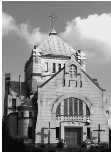
Церква св. великомученика Димитрія в Оброшині