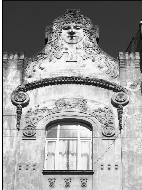
Деталь фасаду будинку на вул. Брюллова, 4 у Львові