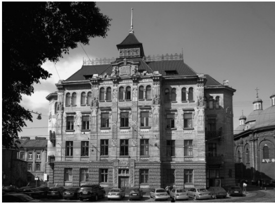
Будинок товариства «Дністер»