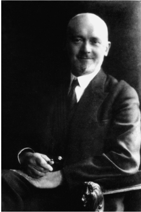
Професор Тадеуш Обмінський, портретне фото