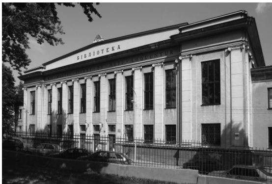
Бібліотека Львівської політехніки